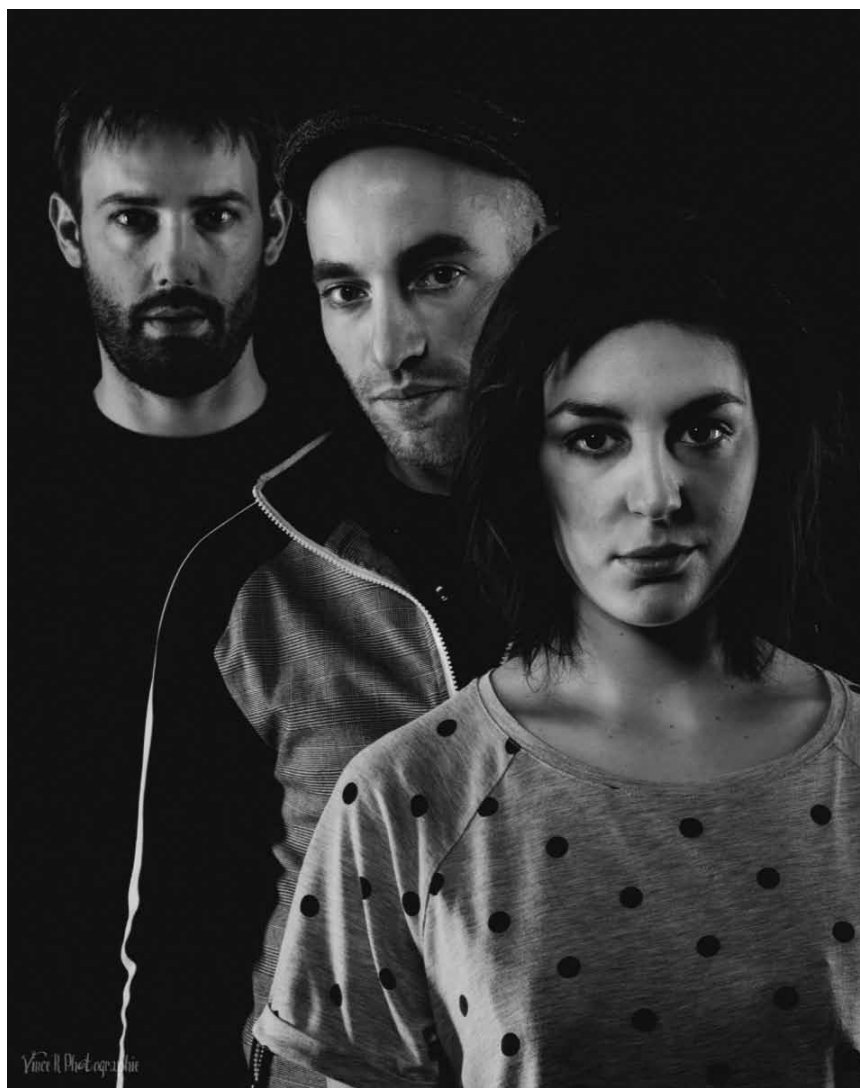
Piano ma non troppo : les explorateurs sonores de Sielle seront à l'Aalt Stadhaus de Differdange le 5 décembre.