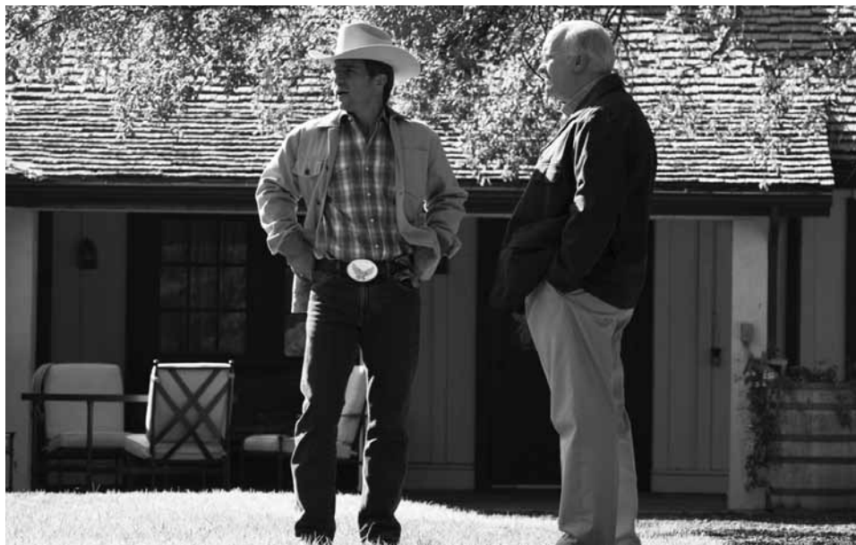
Le cowboy-président et son ministre du vice – et l'on croyait encore que le pire aurait pu nous arriver...