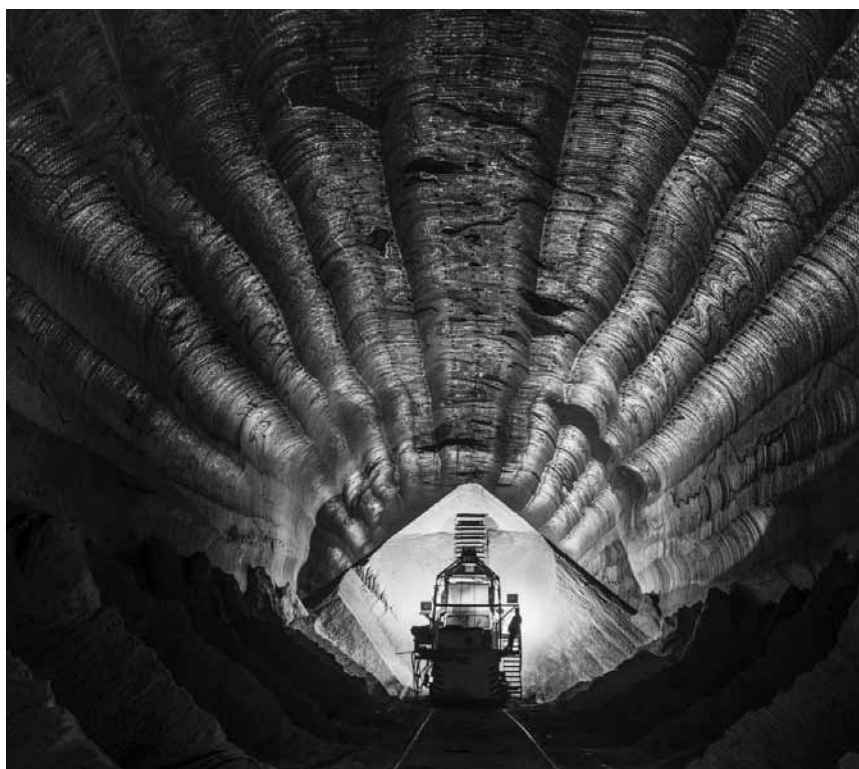
Ein Filmessay, der den Spuren der unersättlichen menschlichen Gier nachgeht: „Anthropocene: The Human Epoch“ – am 8. März im Utopia im Rahmen des Luxfilmfest.

Dans les années 1970, alors que la jeunesse américaine embrasse la culture hippie, en Colombie, la culture de la marijuana devient florissante, transformant les autochtones et agriculteurs en hommes d'affaires chevronnés. Une famille d'indigènes Wayuu se retrouve au premier plan dans cette nouvelle entreprise et découvre le pouvoir et la richesse. C'est la naissance des cartels de la drogue.