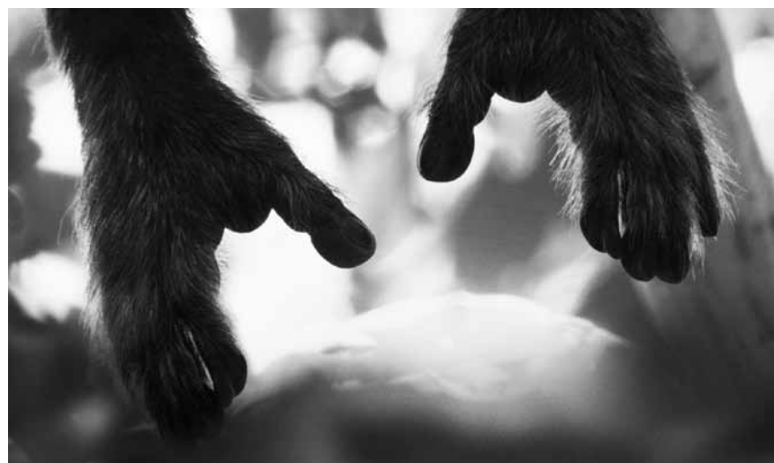
Un tour du monde par Yann Arthus-Bertrand : « Terra », le 12 mars au Kinosch.