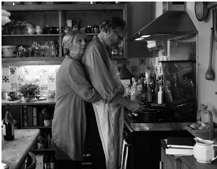
Mike Leigh suit avec sa caméra un couple de sexagénaires qui reçoit des ami-e-s au fil des saisons. Le 12 mars à l'Utopia, dans le cadre du Luxfilmfest.

préparation de la fête du Nouvel An. Une soirée qui s'annonce difficile pour la jeune Sofia en attente de sa mère, qui brille une fois de plus par son absence.