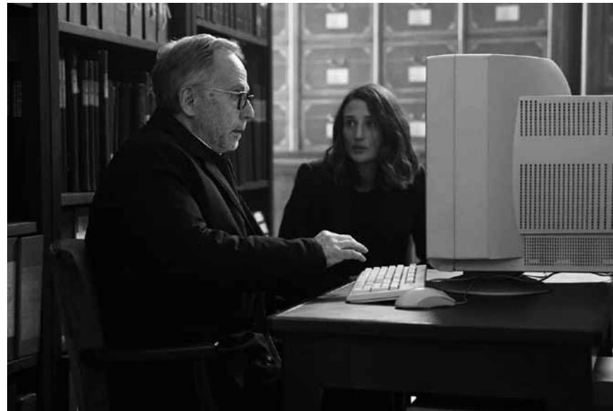
Une enqu  te litt  raire qui va co  ter des nerfs    plus d'un-e : « Le myst  re Henri Pick » - nouveau    l'Utopia.

❖❖❖ « Gräns » dépasse aisément les limites de la narration filmographique ordinaire et crée un