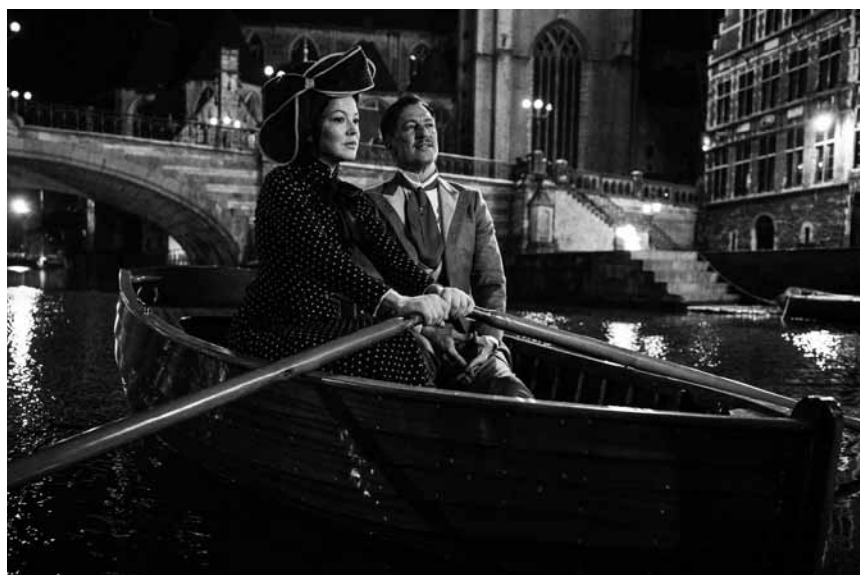
Wo an Brecht die Filmindustrie (fast) zerbricht: „Mackie Messer: Brechts Dreigroschenfilm“, Joachim Langs hochgelobtes Werk läuft am 15. März im Utopia im Rahmen des Luxfilmfest.

F 2019 d'Allan Mauduit. Avec Cécile De France, Yolande Moreau et Audrey Lamy. 87'. V.o.