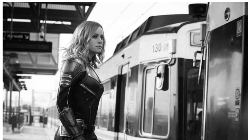
Eine Frau stürzt vom Himmel und räumt ordentlich auf: „Captain Marvel“ - neu in fast allen Sälen.

Pour épier son amant Ludo, Claire Millaud, 50 ans, crée un faux profil sur les réseaux sociaux et devient Clara une magnifique jeune femme de 24 ans. Alex, l'ami de Ludo,