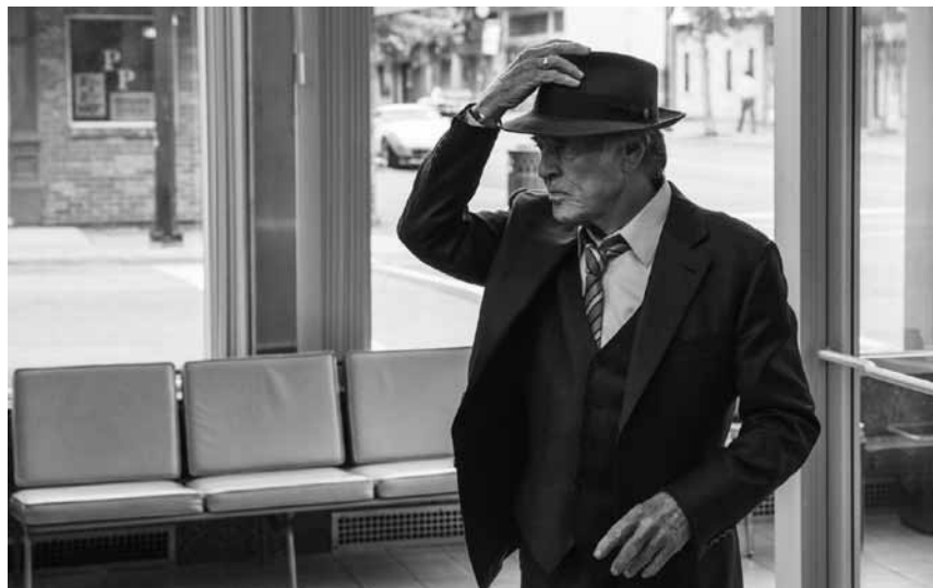
Solche Gentleman-Bankräuber-Modelle werden schon lange nicht mehr gebaut: „The Old Man and the Gun“ - mit Robert Redford und Sissy Spacek, neu im Utopia.

USA/GB/IRL 2019 von Yórgos Lánthimos. Mit Olivia Colman, Emma Stone und Rachel Weisz. 120'. O.-Ton + Ut. Ab 12.