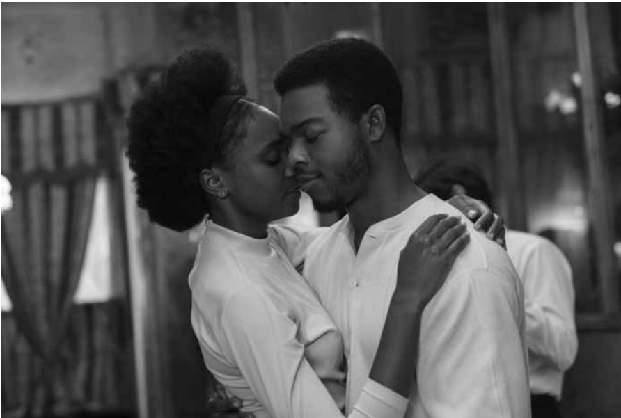
Tish und Fonny stehen symbolisch für die von Rassismus bedrohte Unschuld und Gutmütigkeit.