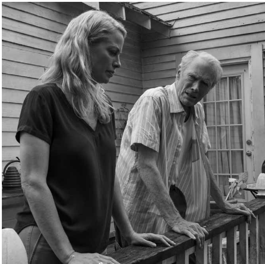
Clint Eastwood kann es nicht lassen: In „The Mule“ schlüpft er in die Haut eines 80-jährigen Drogenkuriers – neu im Kinepolis Kirchberg.

aus Brooklyn erlebt eine mächtige Überraschung, als er von einem Multiversum der parallel existierenden Möglichkeiten erfährt, in dem sich eine fast grenzenlose Anzahl an Spider-Men tumelt, die sich unter der Maske verbergen und ihren Mitbürgern zu Hilfe eilen.