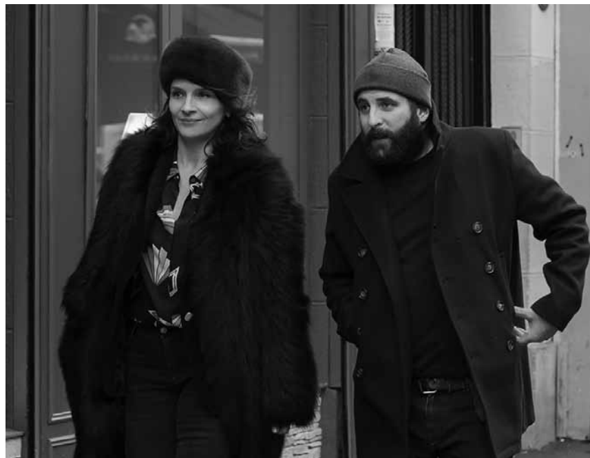
Dans « Doubles vies », le metteur en scène Olivier Assayas s'attaque au monde de l'édition, ses passions et ses mensonges - nouveau à l'Utopia.

1893. Malgré leurs quatorze ans d'écart, Gabrielle Sidonie Colette, jeune fille à l'esprit rebelle, épouse Willy, écrivain aussi égocentrique que séducteur. Grâce à ses relations, elle découvre le milieu artistique parisien qui stimule sa propre créativité. Sachant repérer les talents mieux que quiconque, Willy autorise Colette à écrire - à condition qu'il signe ses romans à sa place. Suite au triomphe de la série des Claudine, il ne tarde d'ailleurs pas à devenir célèbre. Tandis que les infidélités de Willy pèsent sur le couple, Colette souffre de plus en plus de ne pas être reconnue pour son œuvre.