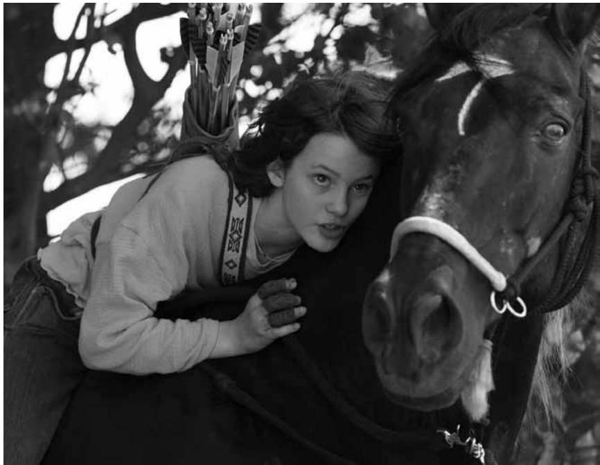
Das Leben ist doch ein Ponyhof... manchmal: „Ostwind 4: Aris Ankunft“ ist neu im Kinepolis Belval und Kirchberg.

Utopia Durch ihre Ehe mit Franz II. wird Maria Stuart 1559 zur Königin von Frankreich. Als ihr Mann nur zwei Jahre später stirbt, weigert sie sich, erneut zu heiraten. Stattdessen beschließt sie, in ihre Heimat Schottland zurückzukehren und den Thron zu besteigen, der rechtmäßig ihr gehört. Doch die schottische Krone trägt mittlerweile Elisabeth I; die zugleich auch Königin von England ist. Es kommt zu einem Machtkampf zwischen den beiden Monarchinnen.