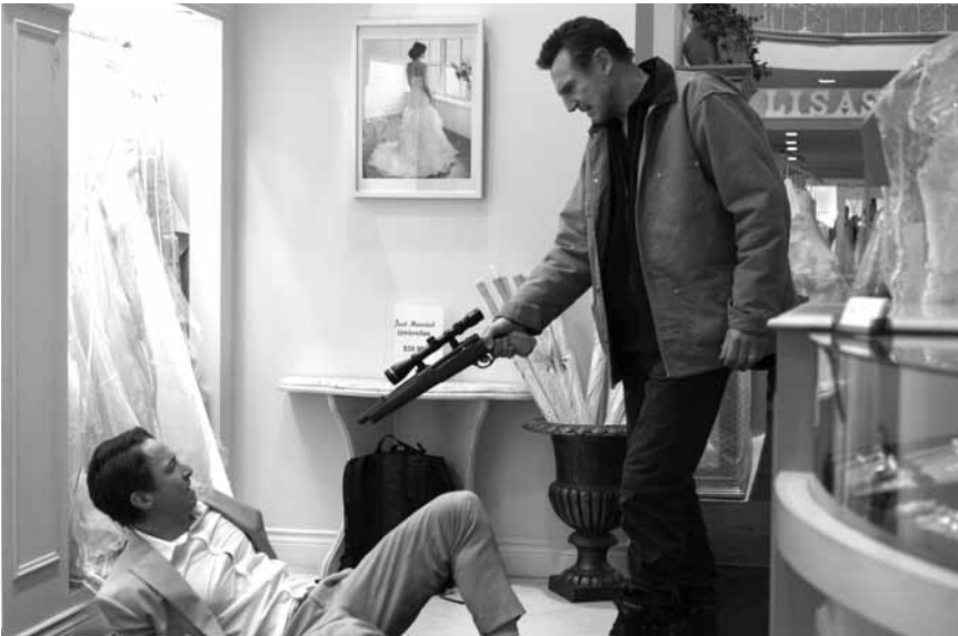
Liam Neeson ist schon wieder (oder immer noch) auf einem Rache trip, diesmal im Schnee: „Cold Pursuit“ neu im Kinopolis Belval und Kirchberg.

F 2019 de Félix Moati. Avec Vincent Lacoste, Benoît Poelvoorde et Mathieu Capella. 90'. V.o. À partir de 6 ans.