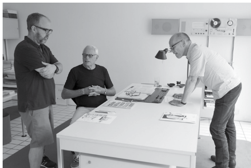
Design, Nachhaltigkeit und Konsumverhalten – darüber denkt der Designer Dieter „Rams“ in seinem Porträt nach: Am 15. März im Utopia, im Rahmen des Luxfilmfest.

Die Coming-of-Age Geschichte eines Jungen der mittels seiner überbordenden Fantasie gegen seine Probleme zu Hause und in der Schule ankämpft.