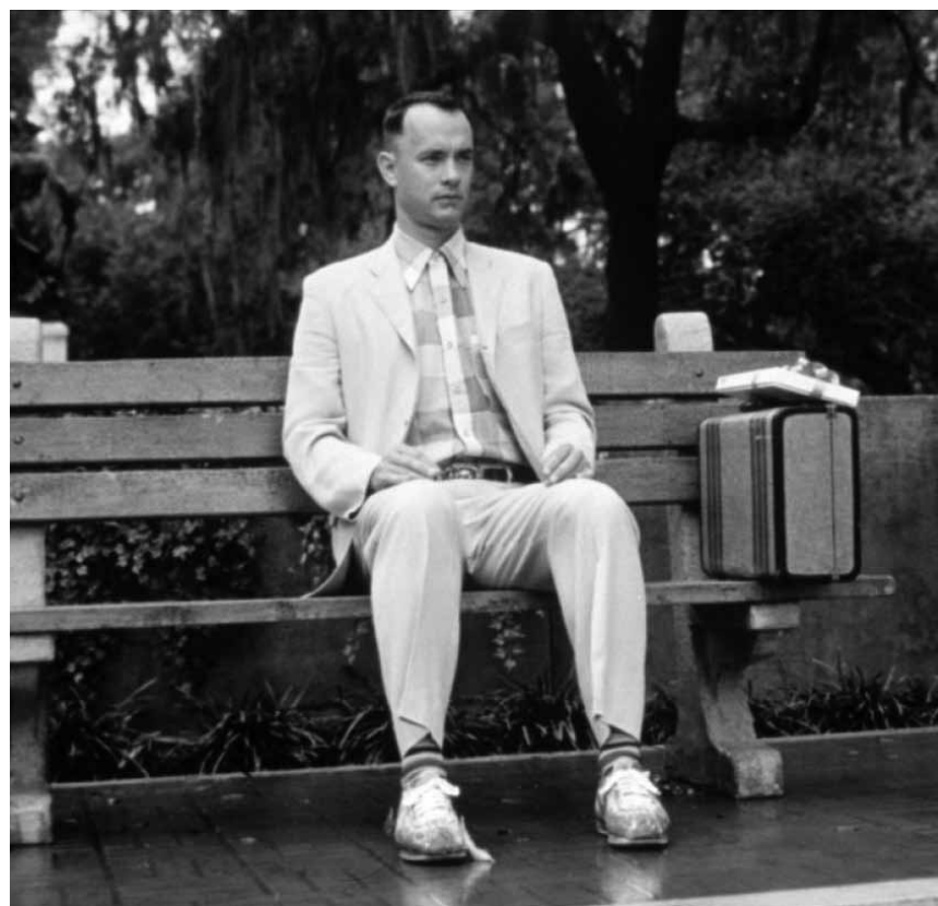
Ein Leben wie eine Schachtel Pralinen: „Forrest Gump“ – der Klassiker mit Tom Hanks läuft am 18. März im Kinopolis Kirchberg und Belval.