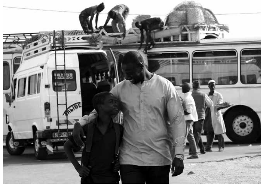
Dans « Yao », un petit garçon emmène un célèbre acteur sur les terres de ses ancêtres - nouveau à l'Utopia.

der Küste verbringen. Doch als die Wilsons mit ihren Freunden zurück in ihrem Ferienhaus sind, nähern sich am Abend plötzlich seltsame und furchteinflößende Gestalten. Die ungebetenen Besucher jagen ihnen nicht nur große Angst ein, sie sehen den einzelnen Familienmitgliedern auch verstörend ähnlich.