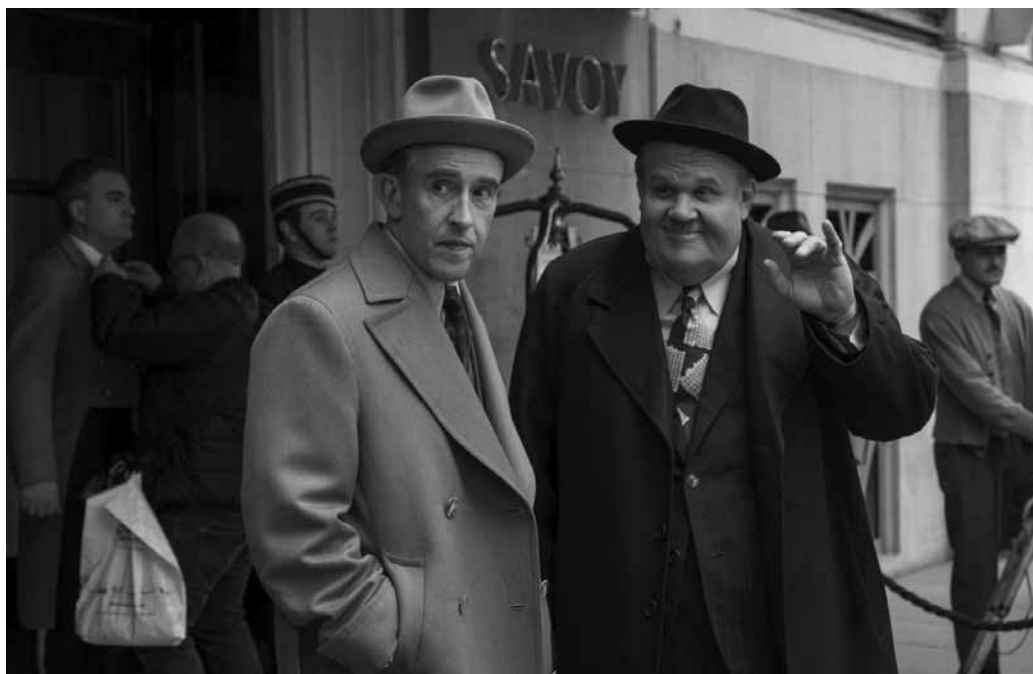
Une dernière aventure pour deux légendes vivantes.