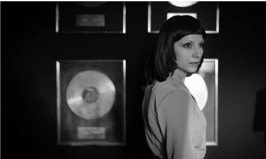
Une chanteuse amnésique doit réapprendre qui elle est pour faire son grand comeback : « Qu'en te cantarà », de Carlos Vermuth, le 30 mars à la Cinémathèque.

accident la rend amnésique. Avec l'aide de Violeta, sa plus grande fan et imitatrice, Lila va apprendre à redevenir qui elle était.