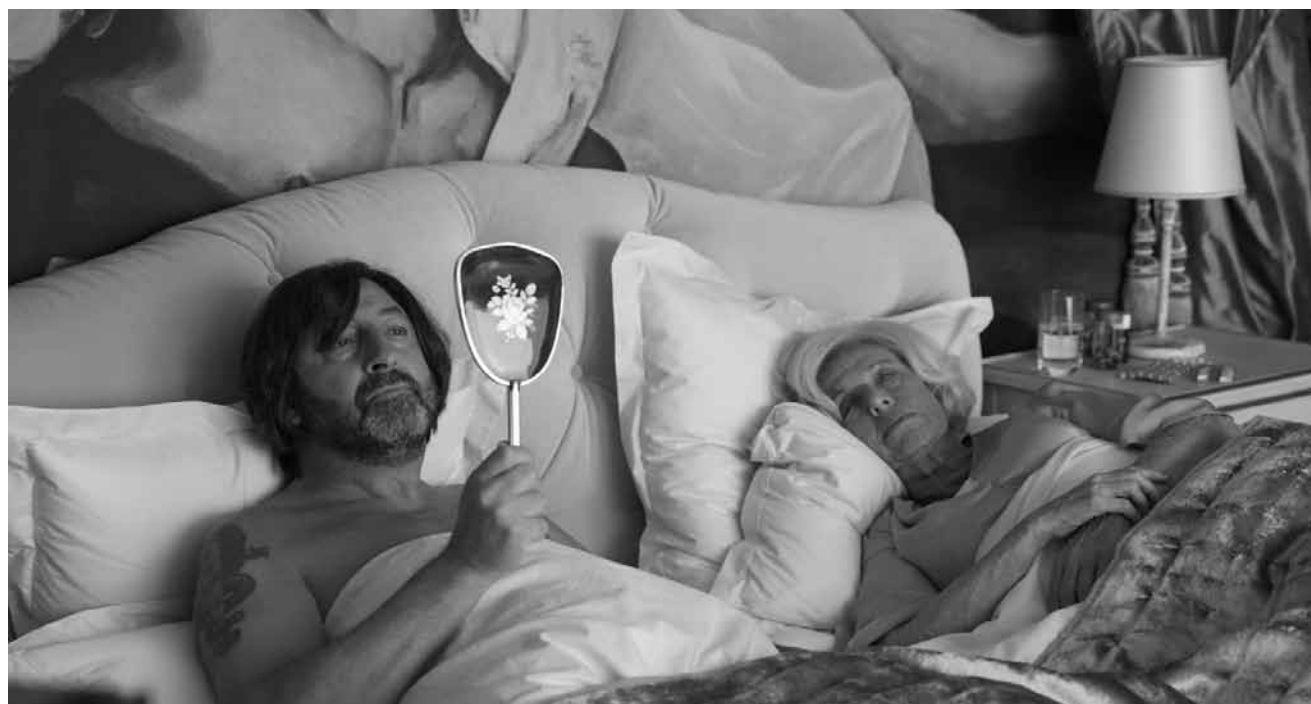
Quand on n'a que son corps pour gagner sa vie : « Just a Gigolo » - nouveau au Scala.

Oui, cette balade dans le sud des États-Unis avec un artiste noir et son chauffeur blanc d'origine italienne est formatée pour les Oscars... mais la performance des deux acteurs principaux et le soin apporté à la réalisation compensent largement certaines ficelles voyantes et parfois trop appuyées du scénario. (ft)