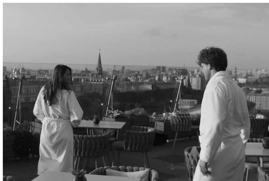
Der schöne Schein wird dem jungen Ayrton zum Verhängnis in der russischen Komödie: „Trezviy Voditel (Sober Driver)“ – am 21. April im Kinopolis Kirchberg.