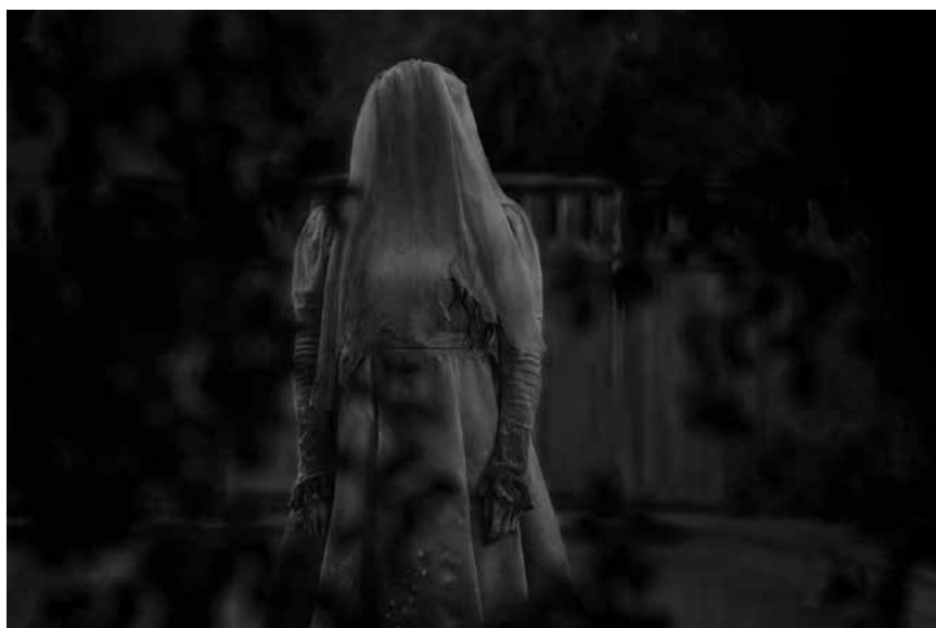
Eine weinende aber untote Frau macht Los Angeles unsicher: „The Curse of La Llorona“ – neu im Kinepolis Kirchberg und im Scala.