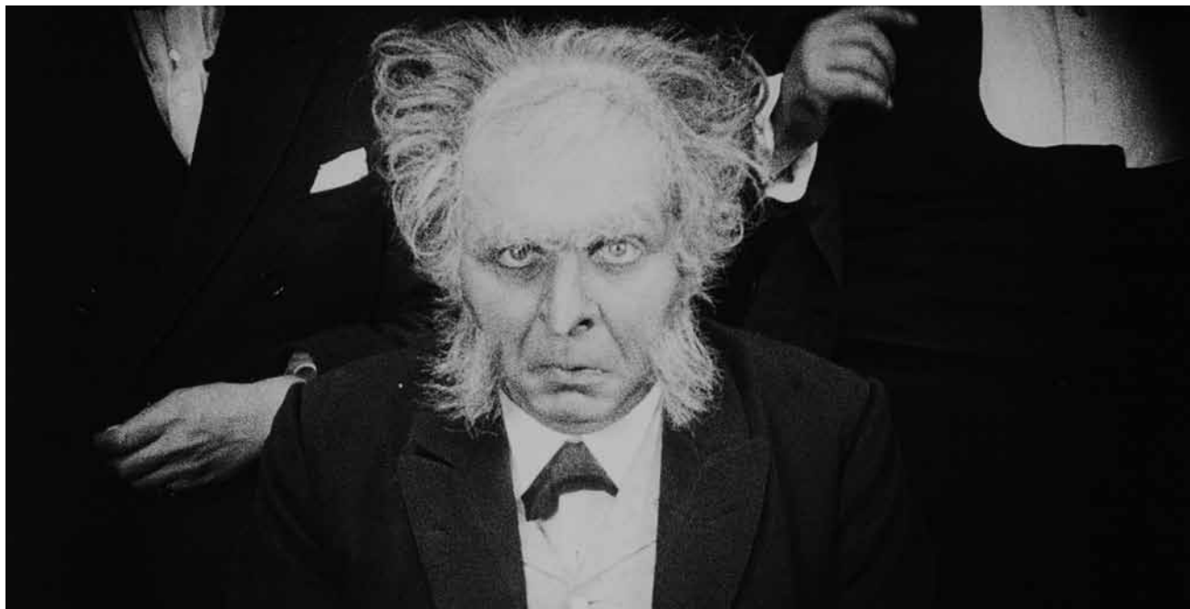
Vom Luxemburger Norbert Jacques erschaffen und von Fritz Lang verfilmt: „Doktor Mabuse, der Spieler“ – Teil eins am 26. und Teil zwei am 28. April in der Cinémathèque.

Dr. Bartholomew Snow ist ein Psychiater mit reichlich eigenen emotionalen Problemen und gleichzeitig ein überragender Wissenschaftler. Deshalb weckt er das Interesse von gleich mehreren internationalen Mächten, die ihn allesamt von Agenten verfolgen lassen. Im ganzen fluchtgetümmel verliebt er sich in die geheimnisvolle Vicky Vincenti. Will sie ihn auch nur für ihre Zwecke oder will sie ihm wirklich helfen?