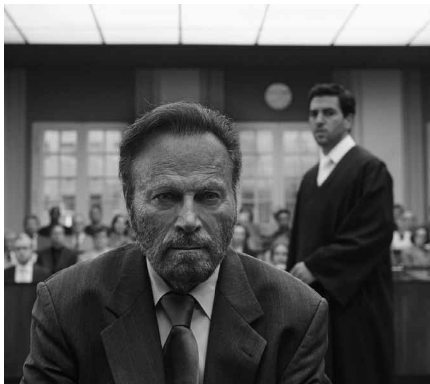
Ein junger Anwalt schlittert in den Fall seines Lebens: „Der Fall Collini“ – nach dem Buch von Ferdinand von Schirach – neu im Kinepolis Belval und Kirchberg.

abgestürzten Maschine, wo er ausharrt und auf Hilfe hofft. Als die langersehnte Rettung in Form eines Hubschraubers ihn endlich zu erreichen scheint, kommt es zu einem folgenschweren Unfall und Overgard muss sich nun auch noch um die schwerverletzte Hubschrauber-Co-Pilotin kümmern.