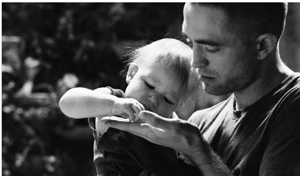
Bébé à bord... pour très, très longtemps.