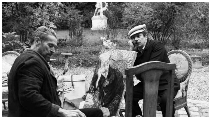
Quand l'obsession de la peinture devient un acte métaphysique : « At Eternity's Gate », le film de Julian Schnabel sur Van Gogh, est nouveau à l'Utopia.