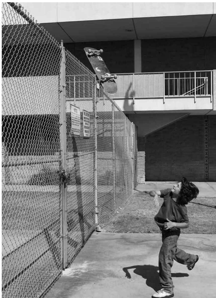
Skaten, Kiffen und einfach nur jung sein: „Mid90s“ von Jonah Hill widmet sich der Nostalgie einer ganzen Generation - neu im Utopia.

❌❌ Grundsätzlich ist „Shazam!“ ein gelungener Superheld*innen-Streifen mit erfrischend menschlichen und humoristischen Komponenten. (tj)