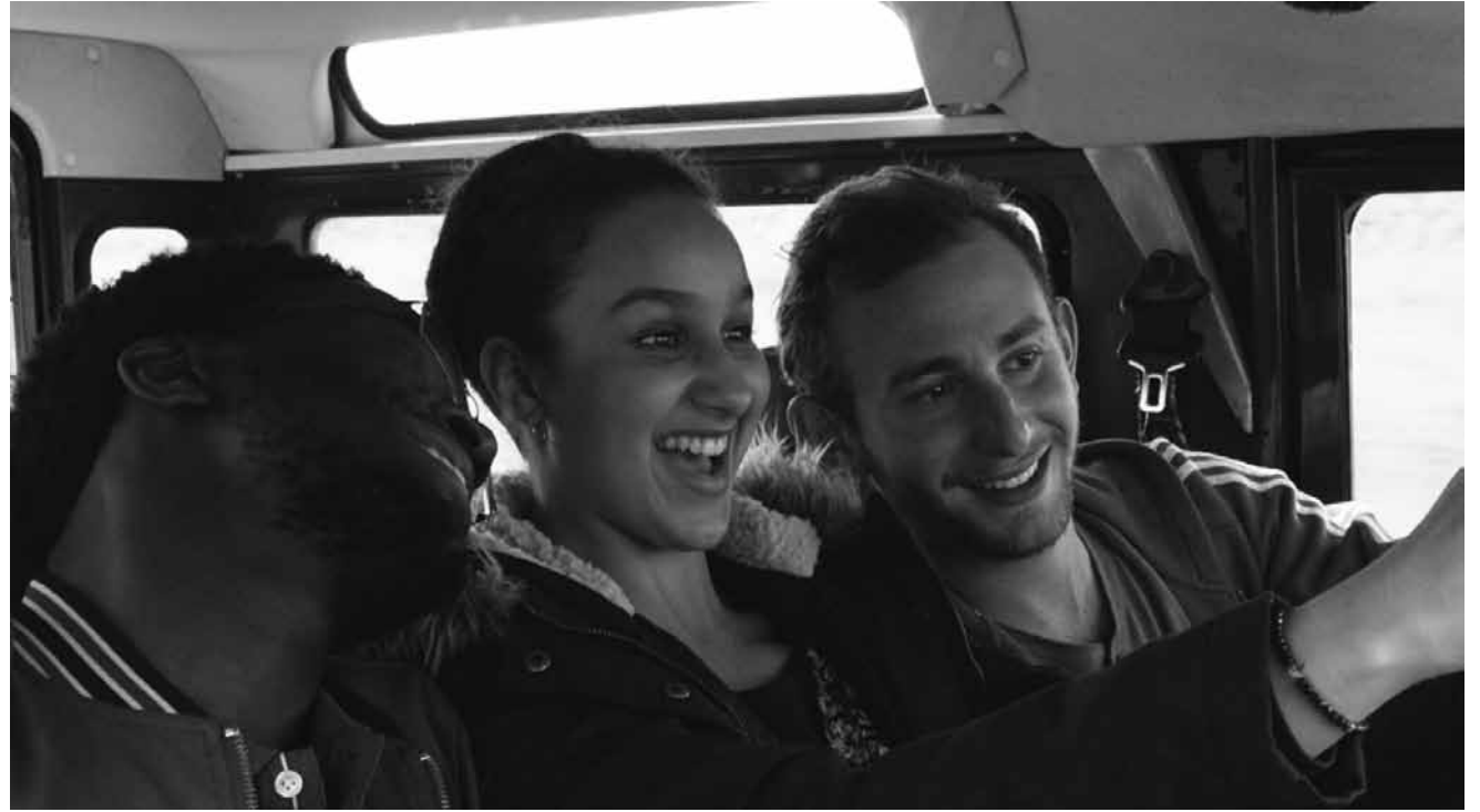
Quand ton petit-fils veut rejoindre Daech... « L'adieu à la nuit », d'André Téchiné, est nouveau à l'Utopia.

Alexandre vit à Lyon avec sa femme et ses enfants. Un jour, il découvre par hasard que le prêtre qui a abusé de lui aux scouts officie toujours auprès d'enfants. Il se lance alors dans un combat, très vite rejoint par François et Emmanuel, également victimes du prêtre, pour « libérer leur parole » sur ce qu'ils ont subi. Mais les répercussions et conséquences de ces aveux ne laisseront personne indemne.