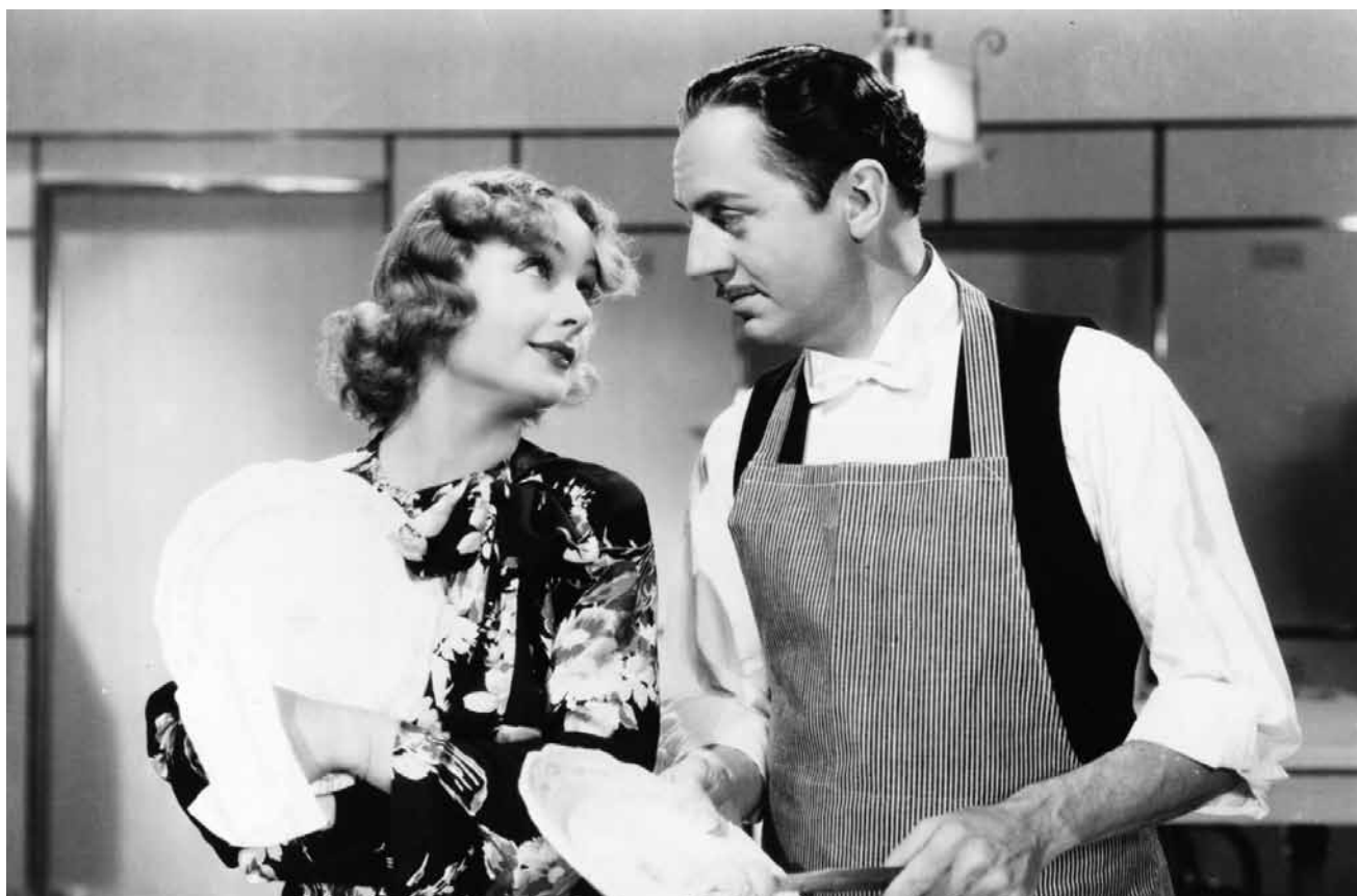
Ein allzu netter Obdachloser nach der großen Depression, das gab es 1936 nur in Hollywood: „My Man Godfrey“ – am 3. Mai in der Cinémathèque.