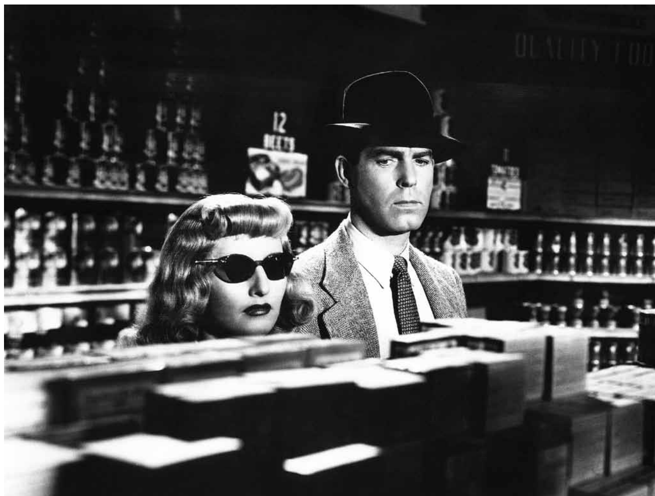
Mord aus Liebe geht nie gut aus: „Double Indemnity“ der Klassiker von Billy Wilder ist am 1. Mai in der Cinémathèque zu sehen.

James, un écrivain quinquagénaire anglo-saxon, donne en Italie, à l'occasion de la sortie de son dernier livre, une conférence ayant pour thème les relations étroites entre l'original et la copie dans l'art. Il rencontre une jeune femme d'origine française, galeriste. Ils partent ensemble pour quelques heures à San Gimignano, petit village près de Florence. Comment distinguer l'original de la copie, la réalité de la fiction ?