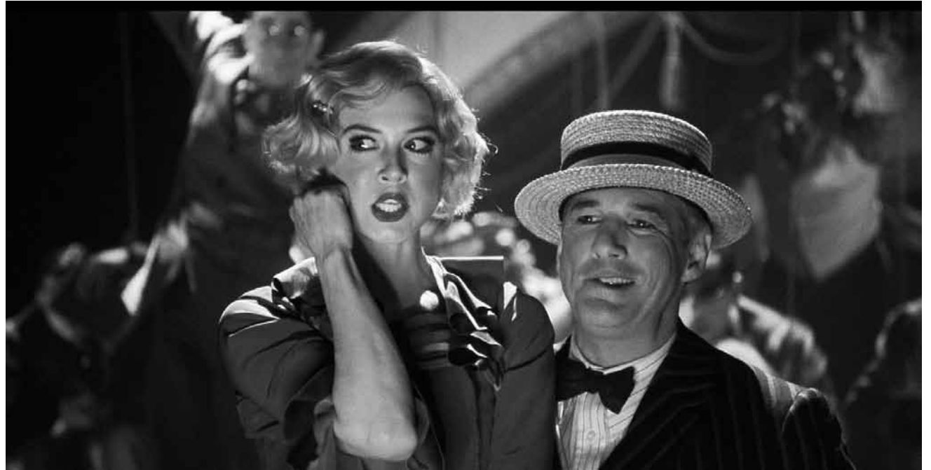
Singen, um aus dem Knast zu kommen, ist in „Chicago“ wörtlich gemeint – an diesem Samstag, dem 27. April in der Cinémathèque.