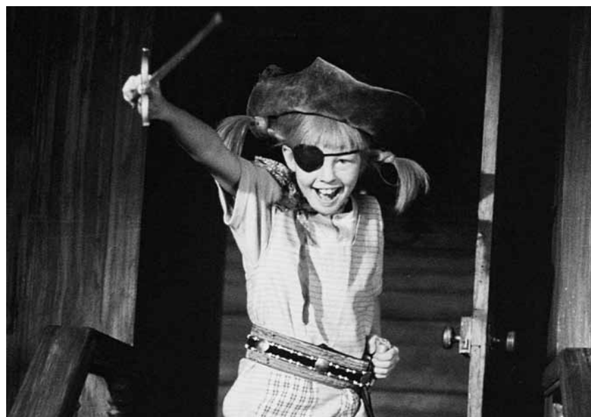
Als die Piraten noch keine Partei waren: „Pippi im Taka-Tuka-Land“ – der Klassiker von 1970 läuft am 30. April im Scala.