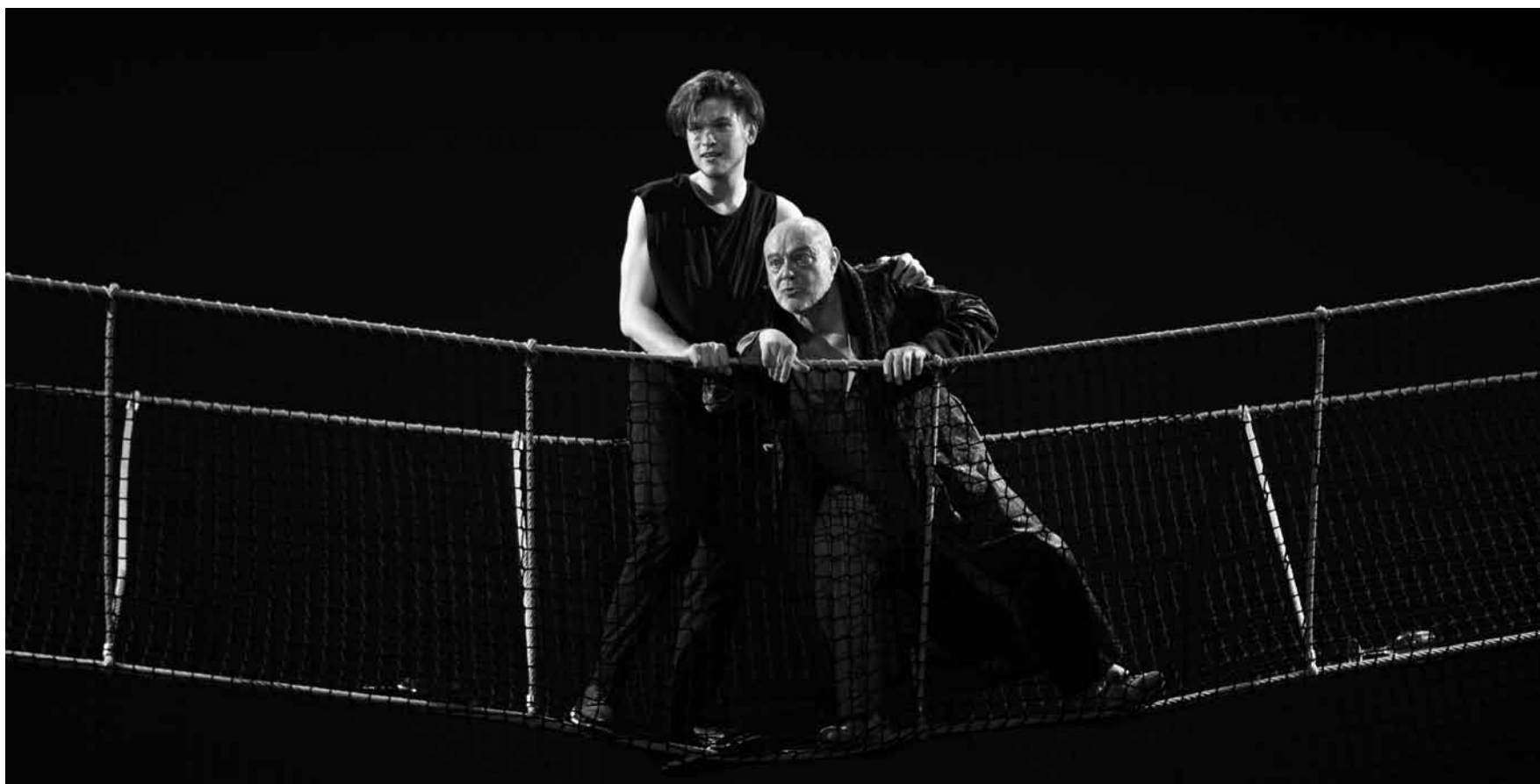
Ein melancholischer Prinz und eine geheimnisvolle Dame ... Georg Büchners gesellschaftskritisches Lustspiel "Leone und Lena" kommt am 24. und am 25. Mai ins Grand Théâtre.

Inscription obligatoire : visites@mudam.lu Langue : L.