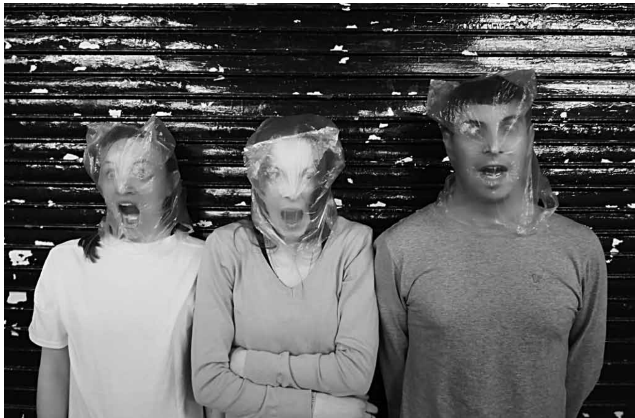
Vom Segen zum Fluch: Plastik beherrscht die Nachrichten, die Weltmeere und die Bühne am 1. Juni im Garely Haus in Saarbrücken mit „Plástico paceres“ von der Kompanie Clinica.