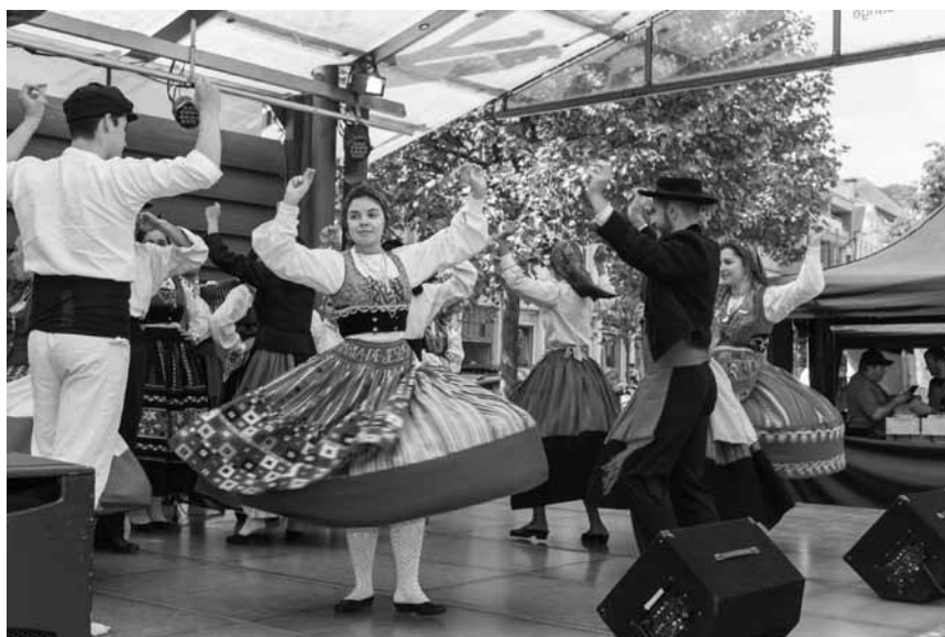
Ce samedi 8 et ce dimanche 9 juin, la ville de Differdange invite à son festival multiculturel sur la place du Marché.