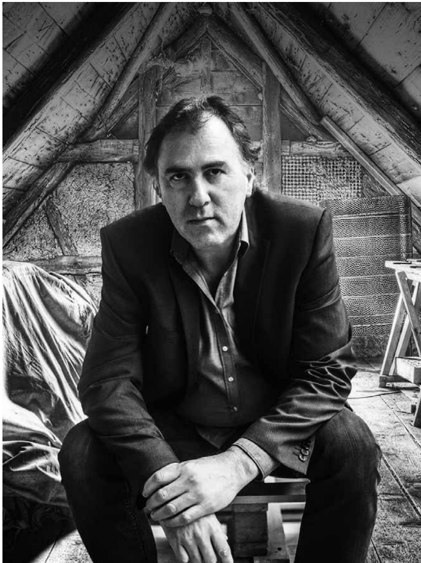
Persönliches kabarettistisch aufgefangen: Stefan Waghübinger kommt am 13. Juni in die Tufa Trier.

Luxembourg, 20h. Tél. 47 96 55 55. www.conservatoire.lu Org. Wäertvullt Liewen asbl.