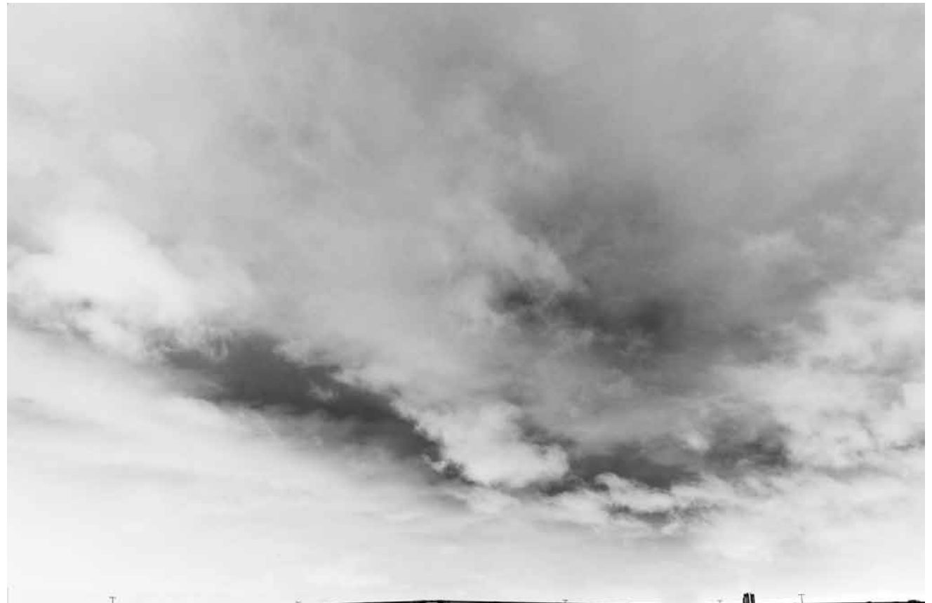
Scruter le ciel pour découvrir les particules noires de carbone : c'est le projet « Noirs de Metz » d'Anaïs Tondeur à la galerie Octave Cowbell de Metz.

LAST CHANCE photographies, salle voûtée de Neimënster (28, rue Munster. Tél. 26 20 52-1), jusqu'au 16.6, ve. - di. 11h - 18h.