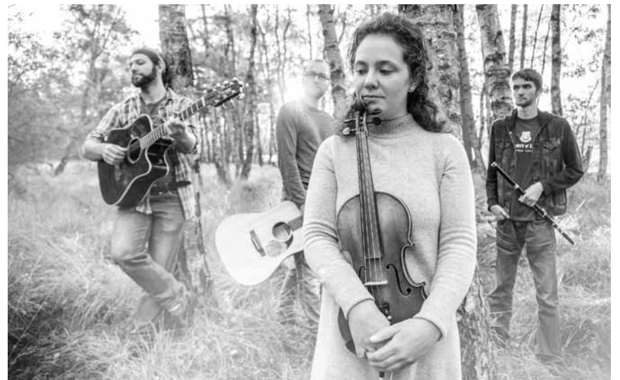
Irischer Folk deutsch verpackt: „Crosswind“ kommt an diesem Freitag, dem 14. Juni in die Tufa Trier.