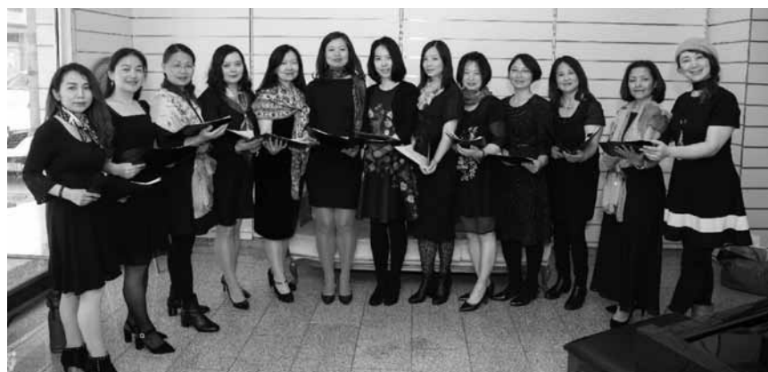
Les ponts culturels entre l'Europe et la Chine seront consolidés avec le concert de la chorale LuSheng au centre culturel Altrimenti, ce samedi 15 juin.

Labos Fest , fête des projets participatifs, à 14h30 « Et wor emol, Draachen? Pst! » du Theaterlabo 6-7 (Black Box, pour tou-te-s), à 15h30 « Achterbahn Vulkan du Theaterlabo » 10-12 B (grande salle, pour tou-te-s), à 16h « Labo Presents: The Heroes Show! » du Theaterlabo 10-12 A (Black Box, pour tou-te-s), à 17h30 « Panik! D'Stad „Camembert“ gëtt attackéiert » du Theaterlabo 8-9 (Black Box, pour tou-te-s), à 18h30 « Help Me Remember Me » du Theaterlabo 13-19 (Black Box, > 10 ans), Rotondes, Luxembourg , 14h. Tél. 26 62 20 07. www.rotondes.lu