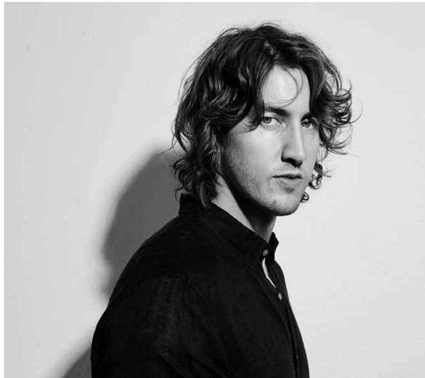
Er hat einen weiten Weg hinter sich: Der australische Singer-Songwriter Dean Lewis tritt am 20. Juni im Atelier auf.

Iwwer d'Schëller: dat klengt A B C vum CNL, Ateliers mat Daphné Boehles, Ludvine Jehin a Pascal Seil, um 11h „d'Bibliothék: méi wéi just Bicher“, um 14h „Autorenlexikon. lu: Wat stécht derhannert?“ um 15h „D'Archiv: Wat gëtt am CNL versuergt?“