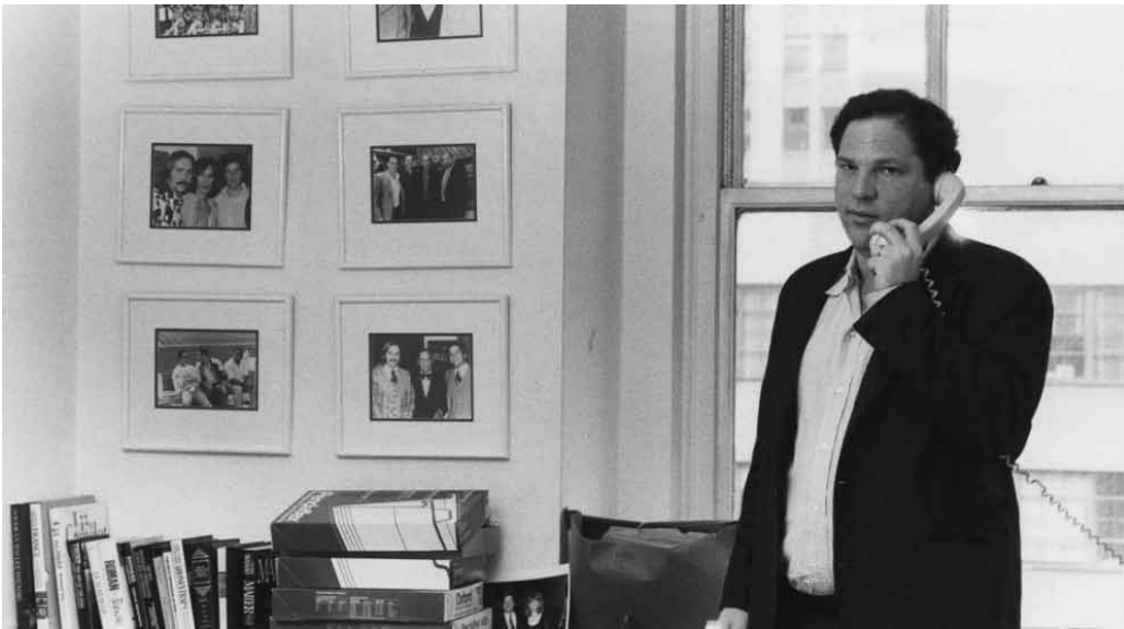
Zeug*innenaussagen zufolge war Harvey Weinstein auch schon in jungen Jahren sexuell gewalttätig gegenüber Frauen.