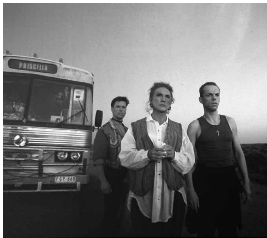
Drei Dragqueens, ein alter Schulbus und die australische Einöde: „The Adventures of Priscilla, Queen of the Desert“, von Stephan Elliott – am 9. Juli im Kinosch.