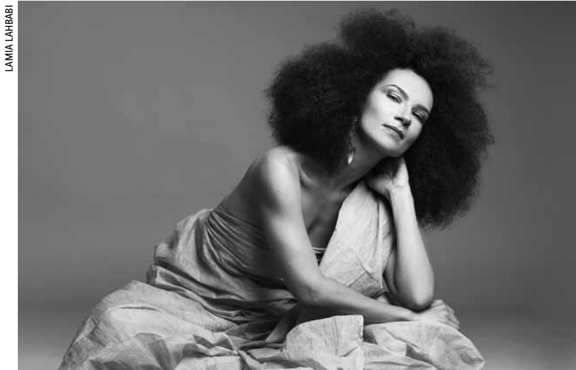
Oum wird die Philharmonie Ende Februar nächsten Jahres beehren.