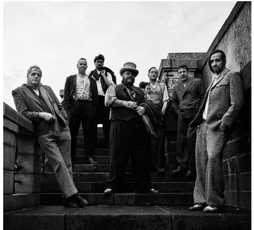
In Extremo, Deutschlands wohl bekannteste Mittelalterrock-Band, tritt an diesem Freitag, dem 26. Juli im Amphitheater Trier auf.