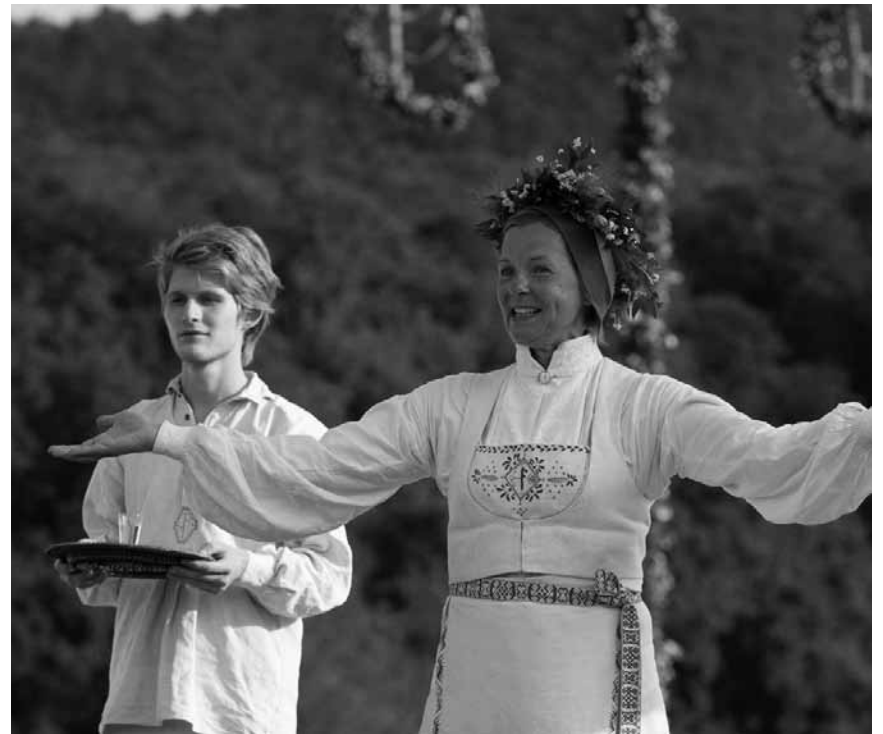
Horror einmal nicht in einem alten amerikanischen Haus sondern „im schwedischen Midsommar“, neu im Kinepolis Kirchberg und Utopia.

China in den 1980er-Jahren zur Zeit der revolutionären Wirtschaftsreform: Zwei Familien, die sich den gewaltigen sozialen und wirtschaftlichen Veränderungen anpassen müssen, treffen nach mehreren Jahren und mehreren Schicksalsschlägen wieder aufeinander.