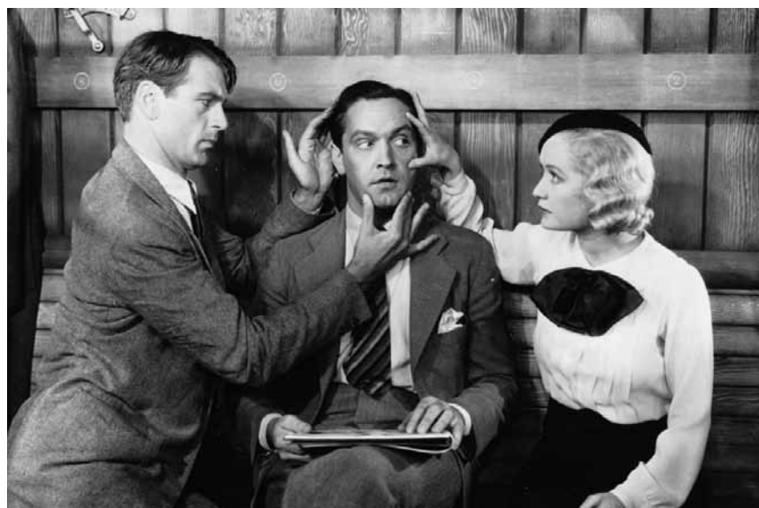
Eine gewagte Dreiecksbeziehung in den 1930er-Jahren: „Design for Living“, am Mittwoch, dem 7. August in der Cinémathèque.

pessimistes les plus endurcis retrouvent le sourire peut taper sur les nerfs des uns ou enchanter les autres. À prendre ou à laisser. (lc)