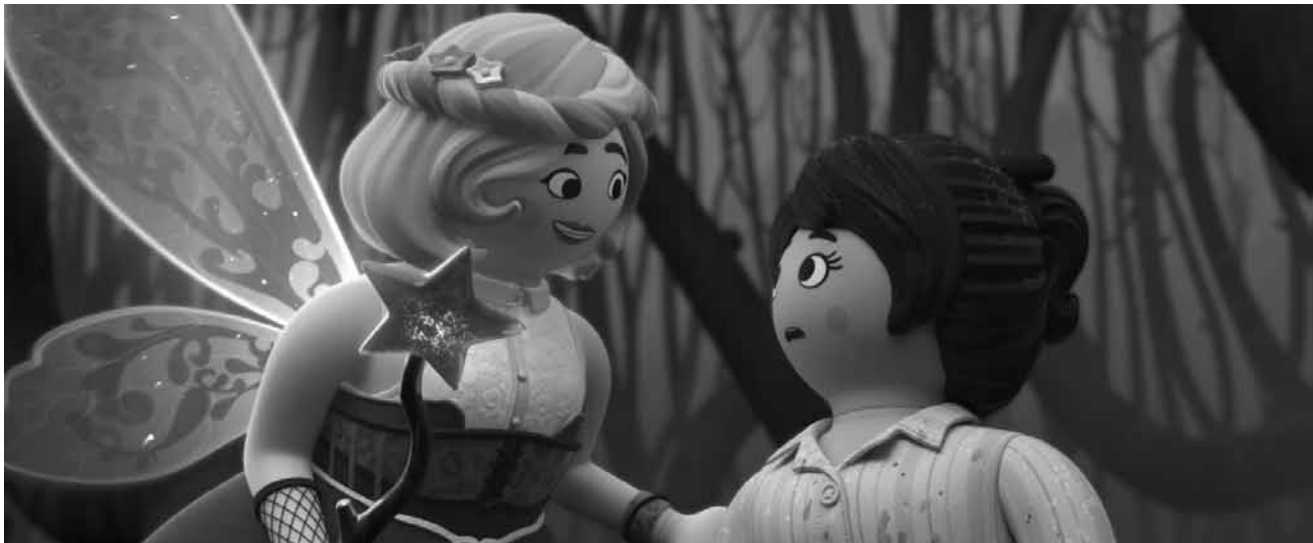
Nach Lego wagt nun auch Playmobil den Schritt in die Filmbranche. „Playmobil: The Movie“ läuft ab dieser Woche in fast allen Sälen.

Ende der 1870er-Jahre wird das Oxford English Dictionary von James Murray publiziert. Da der Redakteur diese gewaltige Aufgabe nicht allein stemmen kann, bekommt er Hilfe vom Psychopathen Dr. William Chester Minor, der als Patient in einer Hochsicherheitspsychiatrie einsitzt und über 10.000 Beiträge verfasst.