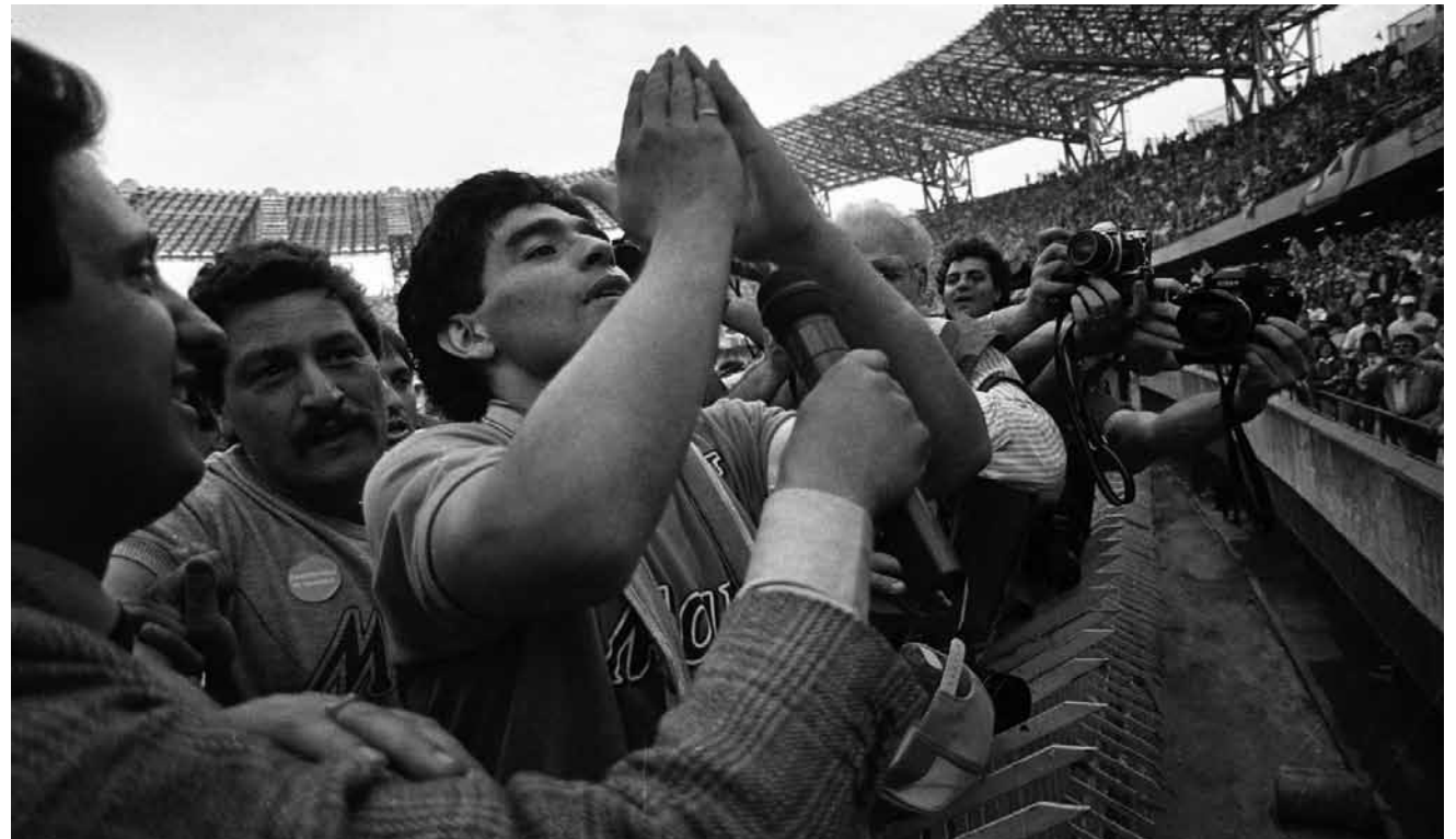
Drogen, Mafia, Lügen und Fußball - das Leben eines besonders talentierten Fußballspielers: Die Doku über „Diego Maradona“ im Kinepolis Kirchberg und Utopia.

Joan Stanley lebt als Rentnerin in einem malerischen kleinen Dorf in England. Doch was hier niemand weiß: Sie war eine der einflussreichsten Spioninnen der Geschichte. Erst als der MI5 plötzlich auftaucht, um sie zu verhaften, kommt ihre geheime Karriere als russische Informantin nach und nach ans Licht. X La performance de Dench est d'autant plus réussie que l'actrice qui incarne Joan jeune, Sophie Cookson,