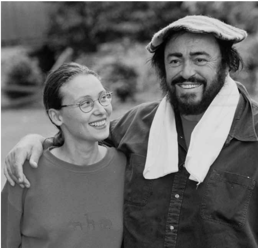
Ohren auf! „Pavarotti“ kommt zurück, und zum Glück nicht in einem schwulstigen Biopic, sondern als Dokumentarfilm - neu im Utopia.

Als eine neue Bedrohung auftaucht, die sowohl die Insel der Vögel als auch die Insel der Schweine in Gefahr