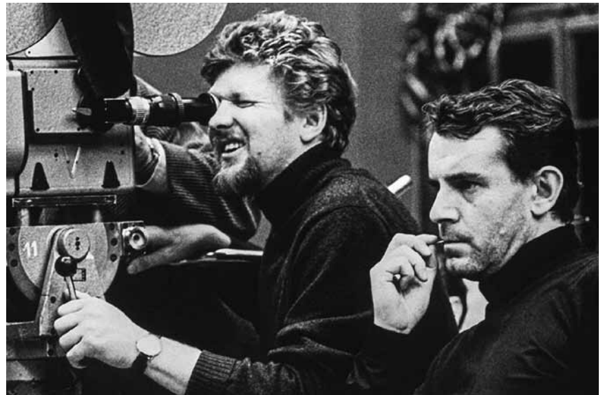
Milos Forman par Forman Milos - le documentaire sur le légendaire réalisateur tchèque « Forman vs. Forman » sera à la Cinémathèque ce samedi 19 octobre.

Cristi doit apprendre le silbo, le mystérieux langage sifflé des Gómeros, aux côtés de la belle Gilda, pour libérer de prison un mafieux et récupérer les millions qu'il a cachés. Entre trahison, déception et plusieurs personnages secondaires, l'histoire prend des tournures inattendues.