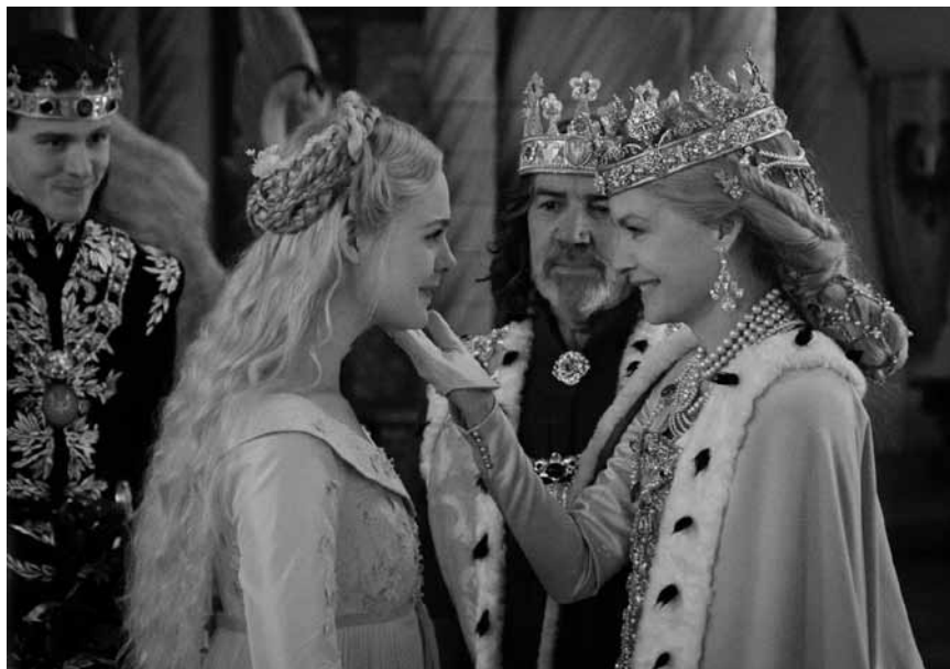
Böse Feen, gute Hexen und viele Bluescreen-Monster: „Maleficent: Mistress of Evil“ – neu in fast allen Sälen.