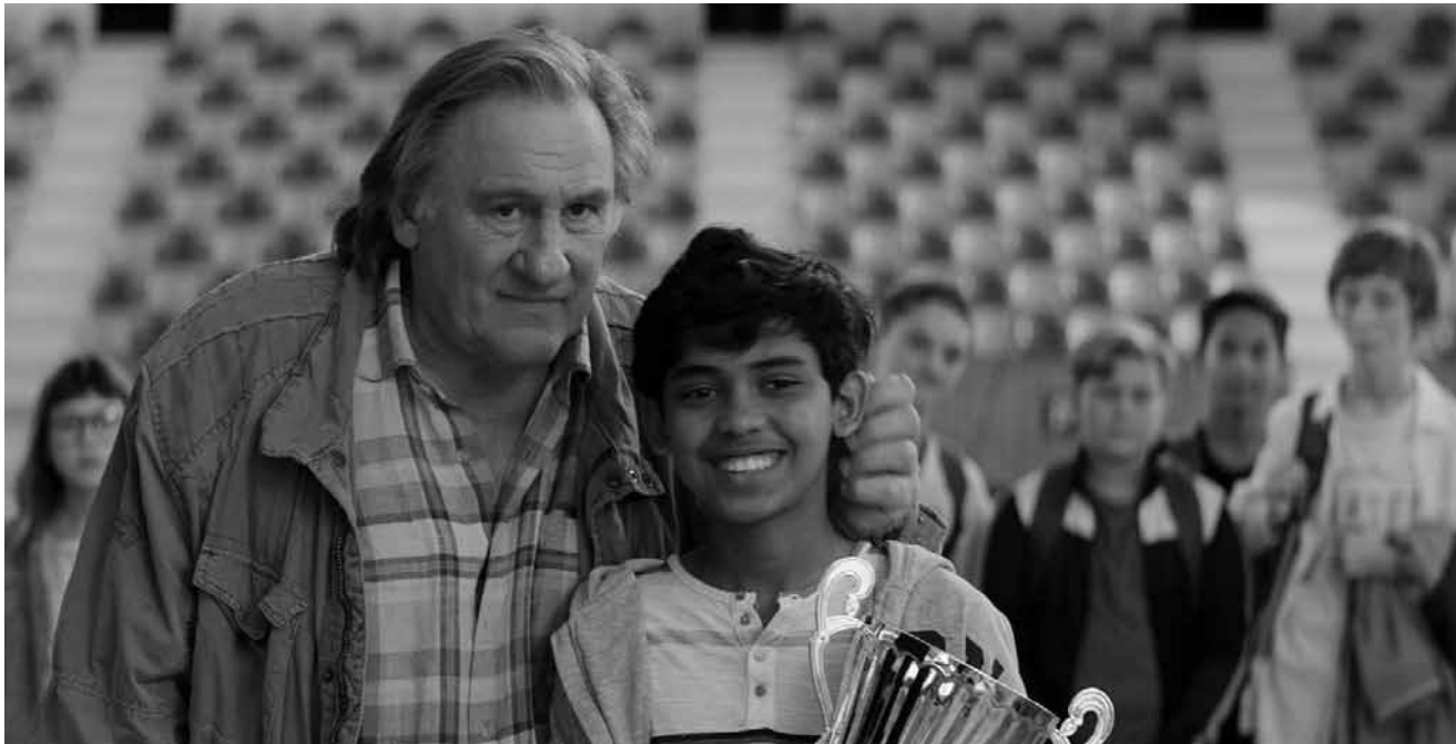
Encore une fable sur la France terre d'asile : « Fahim », nouveau à l'Utopia.

F 2019 de Cédric Klapisch. Avec François Civil, Ana Girardot et Eye Haidara. 110'. V.o. À partir de 6 ans.