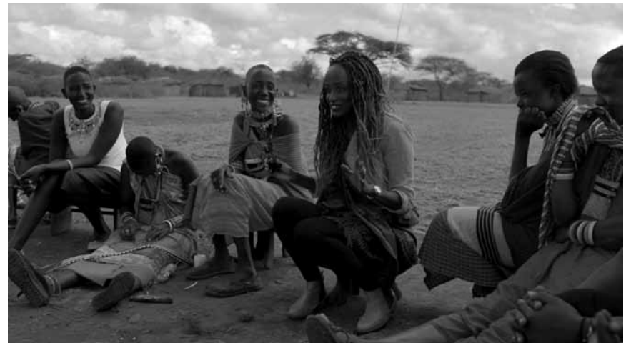
Weibliche Sexualität ist in allen Weltreligionen ein Teufelsding: Der Dokumentarfilm „#Female Pleasure“ veranschaulicht diese Tatsache – am 5. Dezember in der Cinémathèque.

❖❖❖ Für all jene, denen auch der schwärzeste Humor nicht die Laune verdirbt. (Karin Enser)