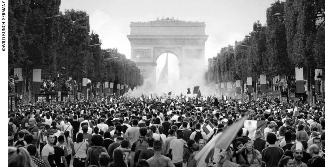
La liesse autour de la Coupe du monde gagnée par les Bleus ne peut plus cacher les divisions profondes d'une France à (au moins) deux vitesses...