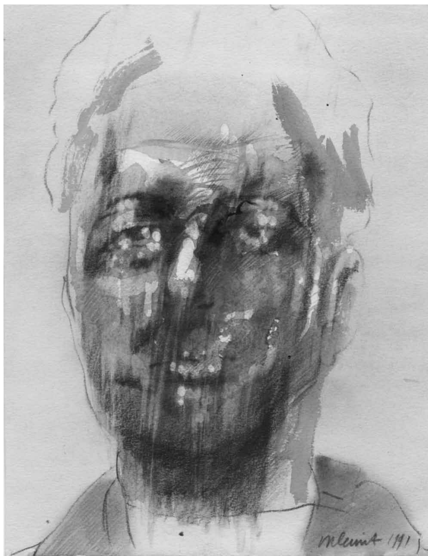
Se plonger dans le regard de l'autre : « Portrait # Dans l'intimité du visage » - exposition collective à l'espace Beau Site à Arlon, encore jusqu'au 17 novembre.