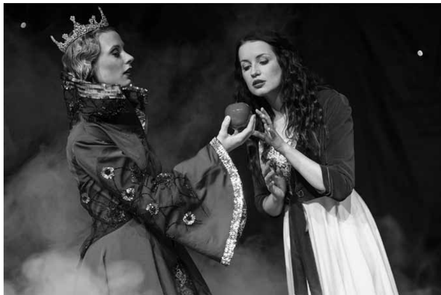
Nicht beißen! Der Apfel ist bestimmt nicht bio ... „Schneewittchen“ macht am 9. Dezember im Trifolion in Echternach halt.

Differdange , 20h. Tél. 5 87 71-19 00. www.stadhaus.lu COMPLET !