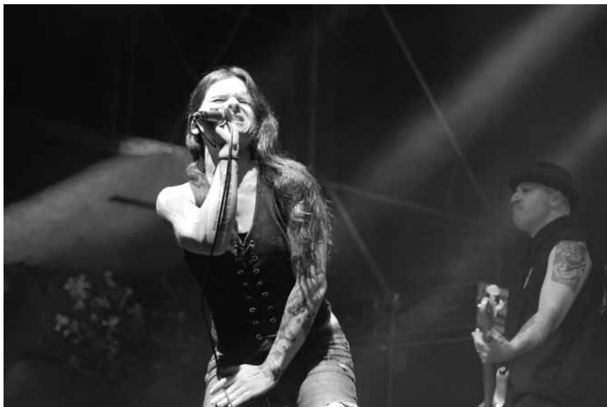
Sicher die erste Metal-Band mit einer transsexuellen Sängerin. Mina Caputo mischt mit Life of Agony am 8. November die Kufa in Esch auf.

Dudelange , 16h. Tel. 51 61 21-811. www.opderschmelz.lu