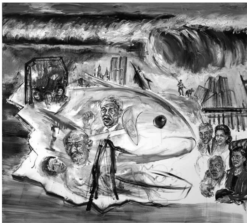
In den „Wellenwelten“ von Albrecht Gehse tummelt sich ein lustiges Völkchen - zu sehen in der Galerie Neuheisel in Saarbrücken bis zum 11. Januar.

prix HSBC pour la photographie, lauréats 2019, Arsenal (3 av. Ney. Tél. 0033 3 87 74 16 16),