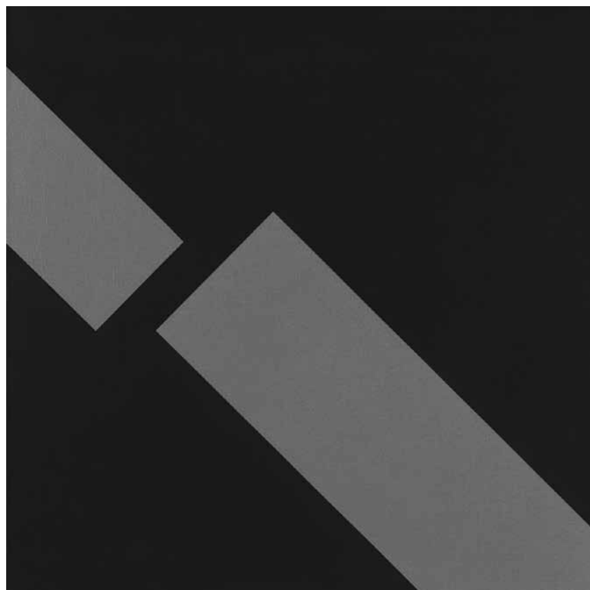
Avis aux amatrices et amateurs de minimalisme abstrait : Christian Floquet expose en ce moment à la galerie Ceysson & Bénétière au Windhof - jusqu'au 15 février 2020.

technique mixte, Ceysson & Bénétière (13-15, rue d'Arlon. Tél. 26 20 20 95), jusqu'au 15.2.2020, me. - sa. 12h - 18h.