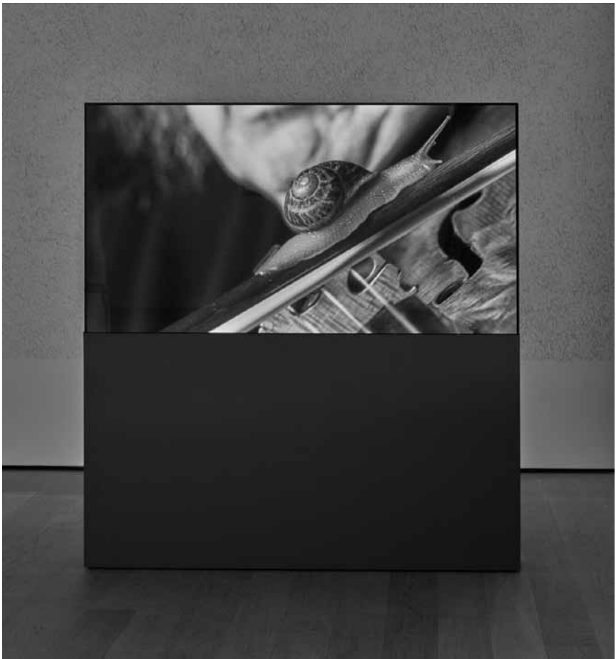
Une expérience mêlant art contemporain, musique classique et jeux de mots grandeur nature : « Le temps coudé », d'Anri Sala, au Mudam jusqu'au 5 janvier 2020.