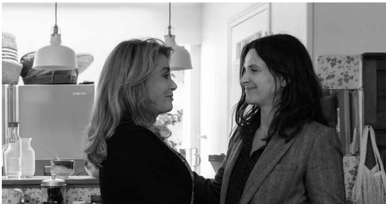
Une relation mère-fille aux mille (mises en) abymes.