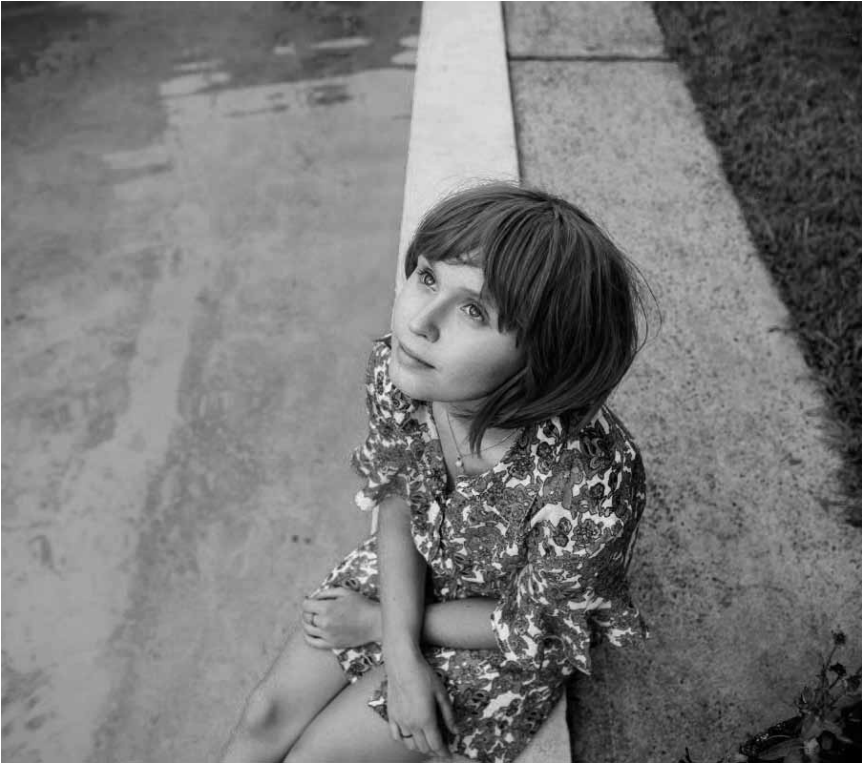
Wenn die erste Liebe einer Krebspatientin wieder auf die Beine hilft, können die Eltern nur zuschauen: „Babyteeth“ im Utopia, der Cinémathèque und dem Kinopolis Kirchberg – im Rahmen des Luxfilmfest.

qui vont incarner l'espoir de sauver leur pays de l'emprise qu'il subit. Nommé par Alexis, Yanis va mener un combat sans merci dans les coulisses occultes et entre les portes closes du pouvoir européen. Là où l'arbitraire de l'austérité imposée prime sur l'humanité et la compassion. Là où vont se mettre en place des moyens de pression pour diviser les deux hommes. Là où se joue la destinée de leur peuple.