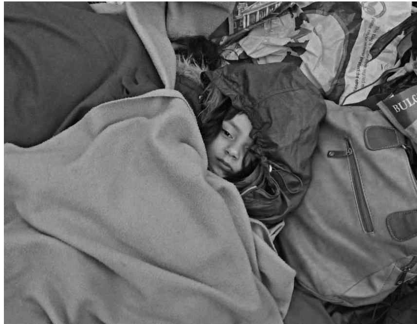
Wer sich in Afghanistan für Frieden einsetzt wird verfolgt, wer vor dem Krieg flieht erniedrigt: „Midnight Traveler“ – im Utopia und in der Cinémathèque im Rahmen des Luxfilmfest.

À Mexico, seulement 45 ambulances officielles sont utilisées par le gouvernement pour servir neuf millions d'habitants. Dans l'un des quartiers les plus riches de la ville, la famille Ochoa gère son service d'ambulances indépendant, en concurrence directe avec les autres