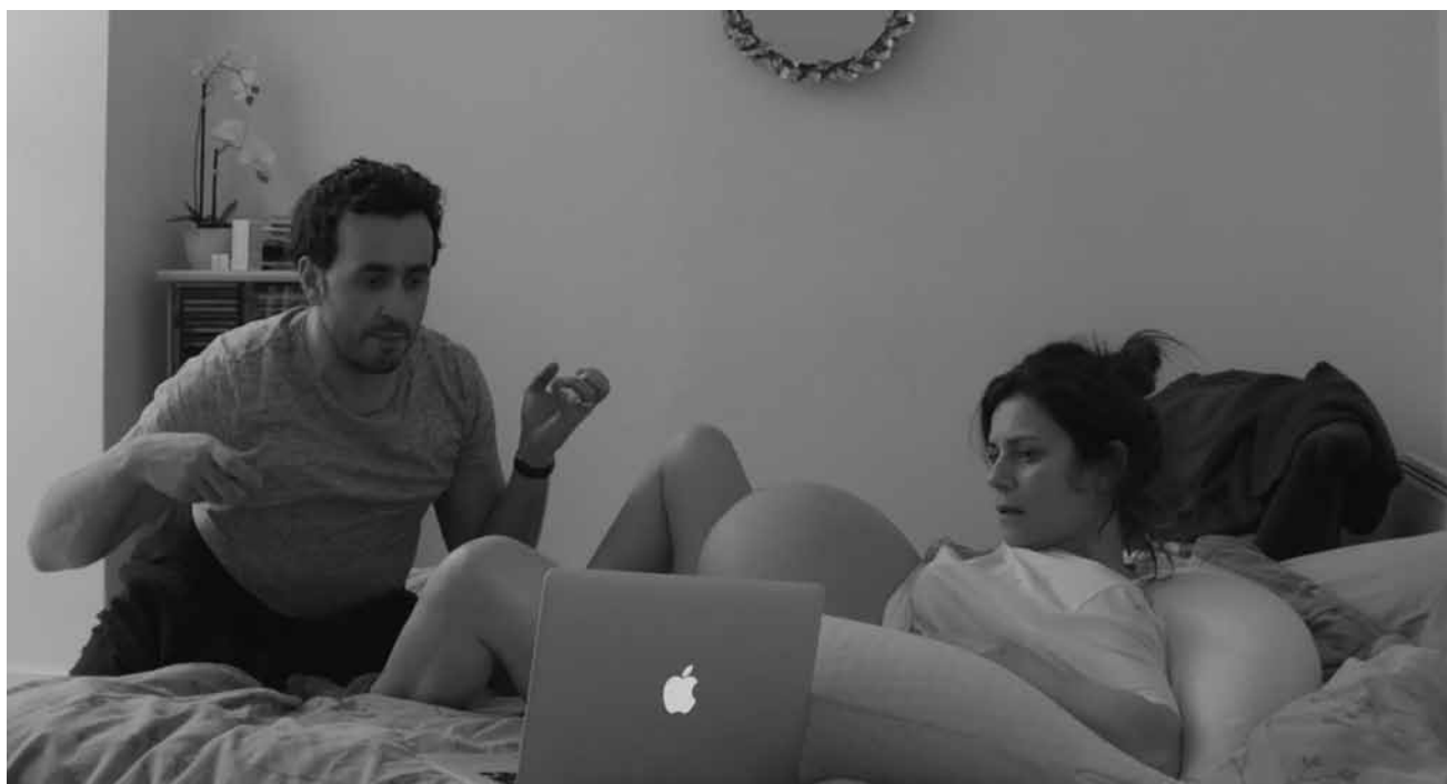
Quand un couple qui ne s'intéresse pas aux gosses en attend un, ça peut devenir « Énorme » - à l'Utopia dans le cadre du Luxfilmfest.