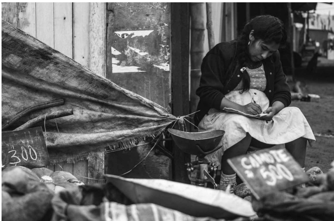
Quand l'église péruvienne organisait les rapt d'enfants indigènes : « Canción sin nombre (Song Without a Name) » se base sur une histoire vraie – à la Cinémathèque dans le cadre du Luxfilmfest.