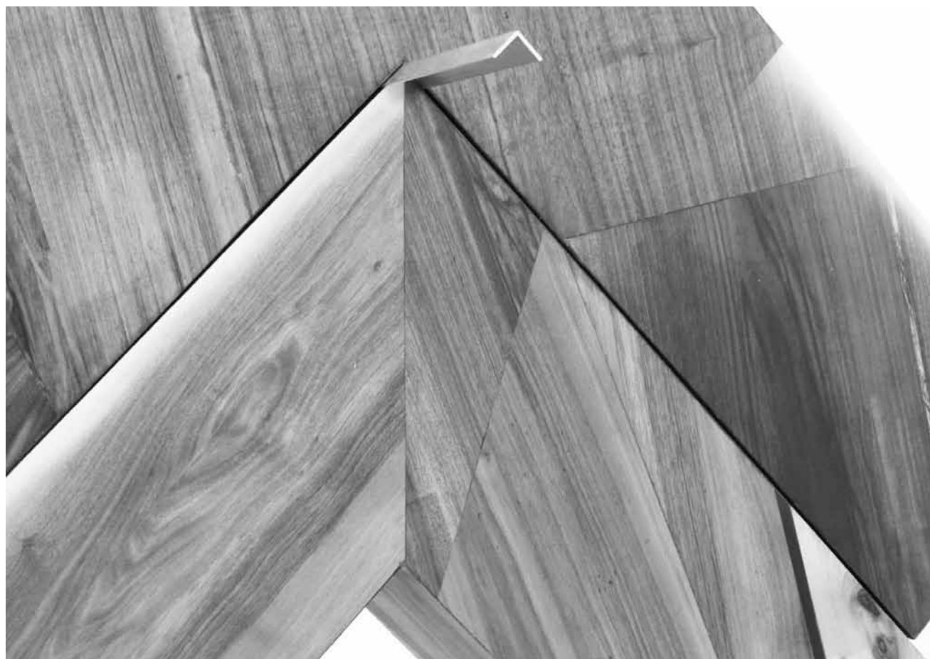
Große und kleine Abstände: Yasmin Alts Skulpturen „The Space between the Objects“ sind noch bis zum 11. Januar im Kunstverein Junge Kunst in Trier zu sehen.

Moderne Galerie des Saarlandmuseums (Bismarckstr. 11-15.