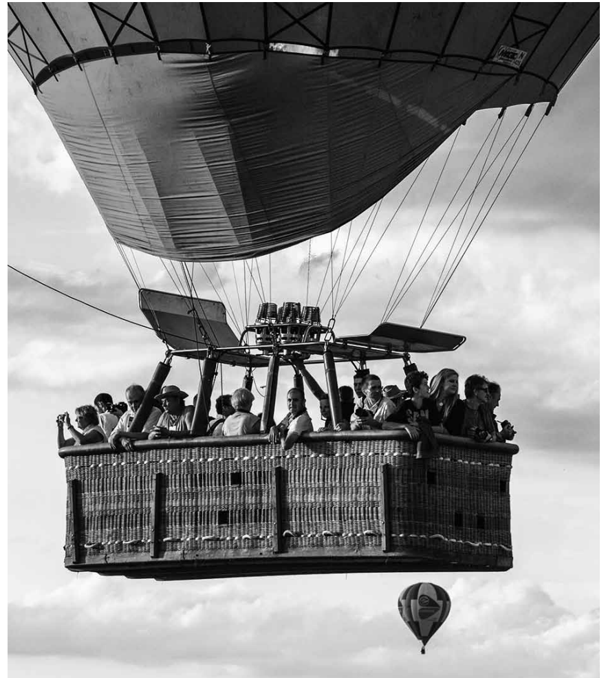
Vers de nouveaux horizons : le 5e Championnat national de la photographie et salon d'auteurs des Fotosfrënn Käerjeng se tient jusqu'au 19 janvier au Kulturhaus Kärjenger Treff.