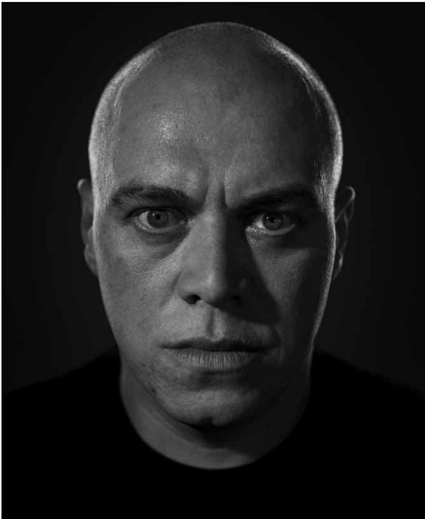
Die Gesichter, jener die gerne hinter Gittern vergessen werden: „K.N.A.S.T.“, von Thea Weires, ist ein Fotoprojekt mit Insassen und Bediensteten der JVA Düsseldorf – zu sehen im Trifolion Echternach vom 2. bis zum 13. Februar.

Biennale du livre d'artiste espace Beau Site (av. de Longwy, 321. Tél. 0032 478 52 43 58), jusqu'au 16.2, lu. - ve. 9h - 18h30, sa. 9h30 - 17h, di. 15h - 18h.