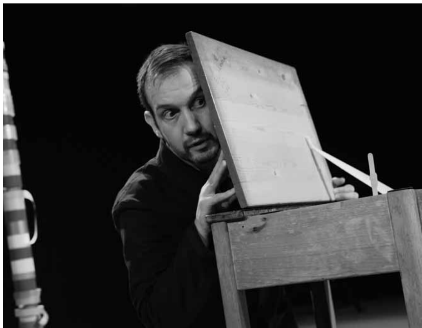
Théâtre d'objets muet mais plein d'inventivité : « Stick by Me », un spectacle pour tous les âges, les 27 et 28 février aux Rotondes.

Recycled , acht Schlagzeuger erobern die Bühne (9-12 Jahre), Philharmonie, Luxembourg, 17h. Tel. 26 32 26 32. www.philharmonie.lu