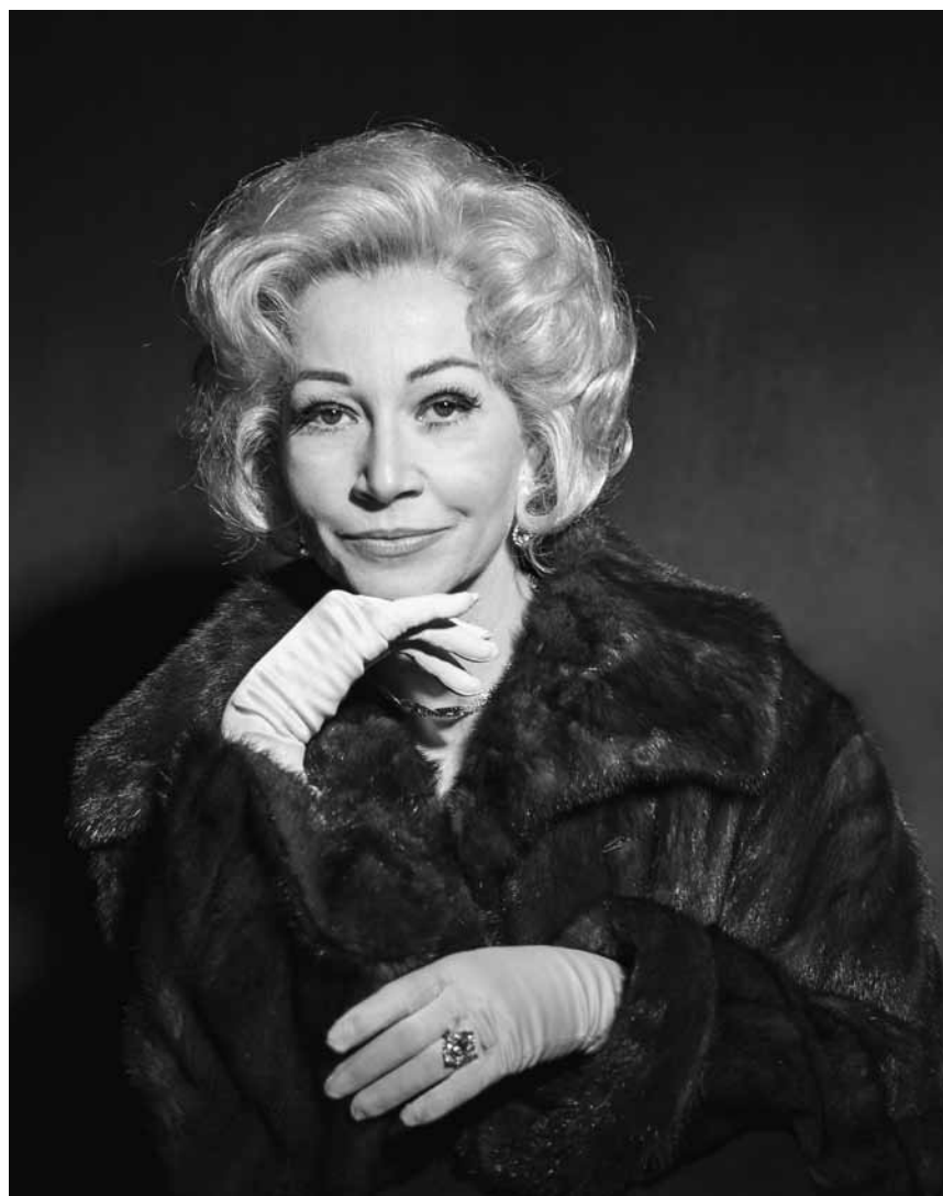
Sie war nicht nur von Kopf bis Fuß auf Liebe eingestellt: „Marlene“ Dietrich erfuhr im Nachkriegsdeutschland nicht nur Begeisterungstürme - das Musical von Pam Gems hat am 1. Februar im Theater Trier Premiere.

Souliers rouges , texte d'Aurélié Namur, mise en scène de Félicie