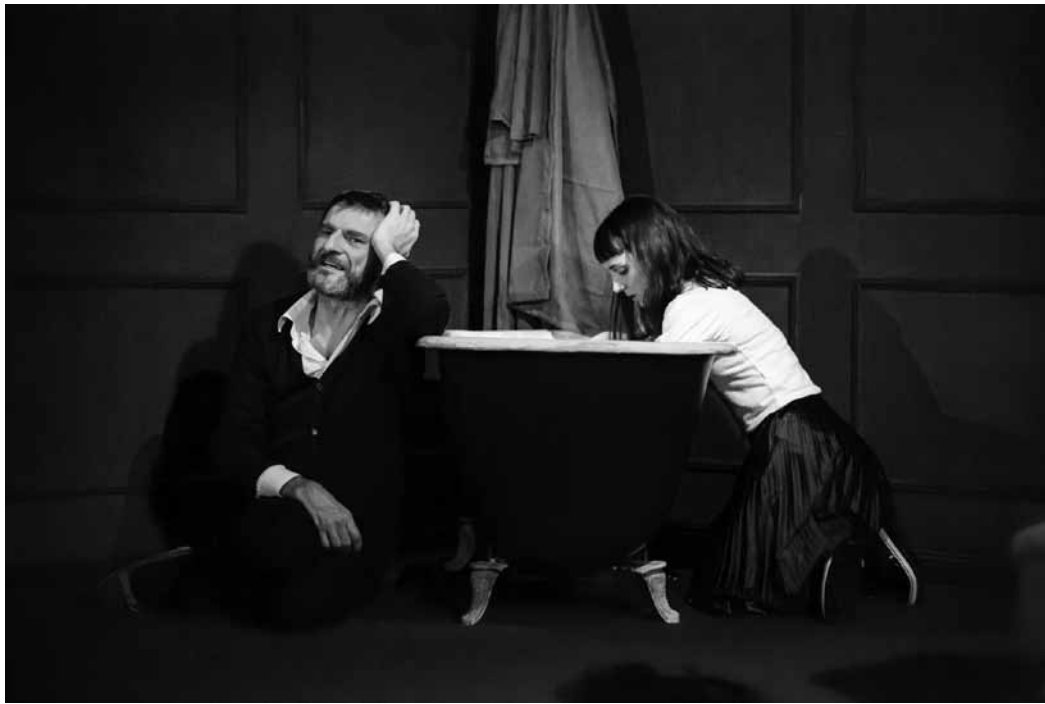
La baignoire, véritable troisième rôle de la pièce, poisson oblige.