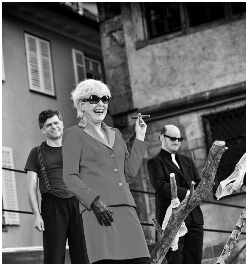
Marnach bereitet sich vor auf „Der Besuch der alten Dame“ - am 31. Januar im Cube 521.

He Who Gets Slapped , Vorführung des Stummfilms von Victor Sjöström (USA 1925. 95'), musikalische Begleitung an der Orgel mit Benjamin Pras, église, Contern, 20h.