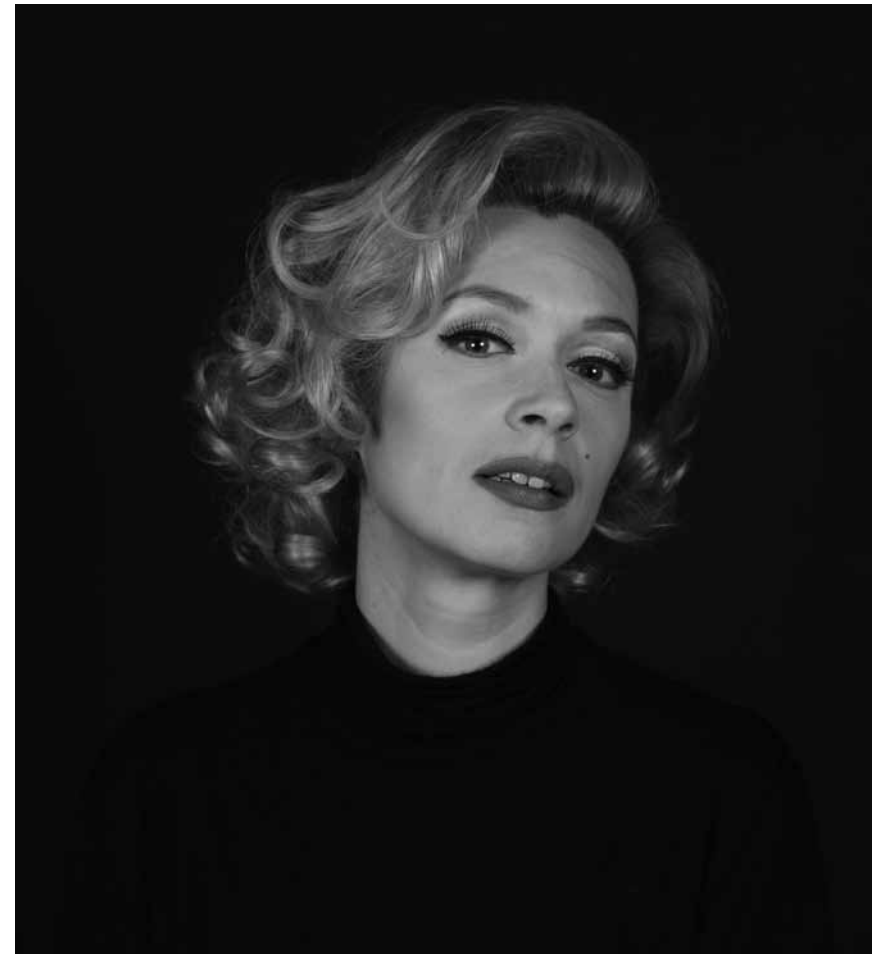
Oper für eine Unsterbliche: „Marilyn Forever“ von Gavin Bryars am 8., 13. und 14. Februar im Saarländischen Staatstheater Saarbrücken.

Vous organisez une expo ou un événement et vous voudriez l'annoncer dans le woxx ? Envoyez-nous toutes les informations nécessaires à agenda@woxx.lu Date limite d'envoi pour le numéro 1567 (14.2 - 23.2) : me. 12.2., 9h.