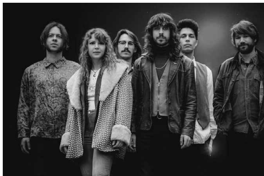
Mêlant folk et psychédéisme avec succès depuis des années, Altin Gün et sa bande feront planer la Kulturfabrik le 14 février.

Festival Haunting the Chapel , avec Obscura, God Dethroned, Thulcandra et Fractal Universe, Les Trinitaires,