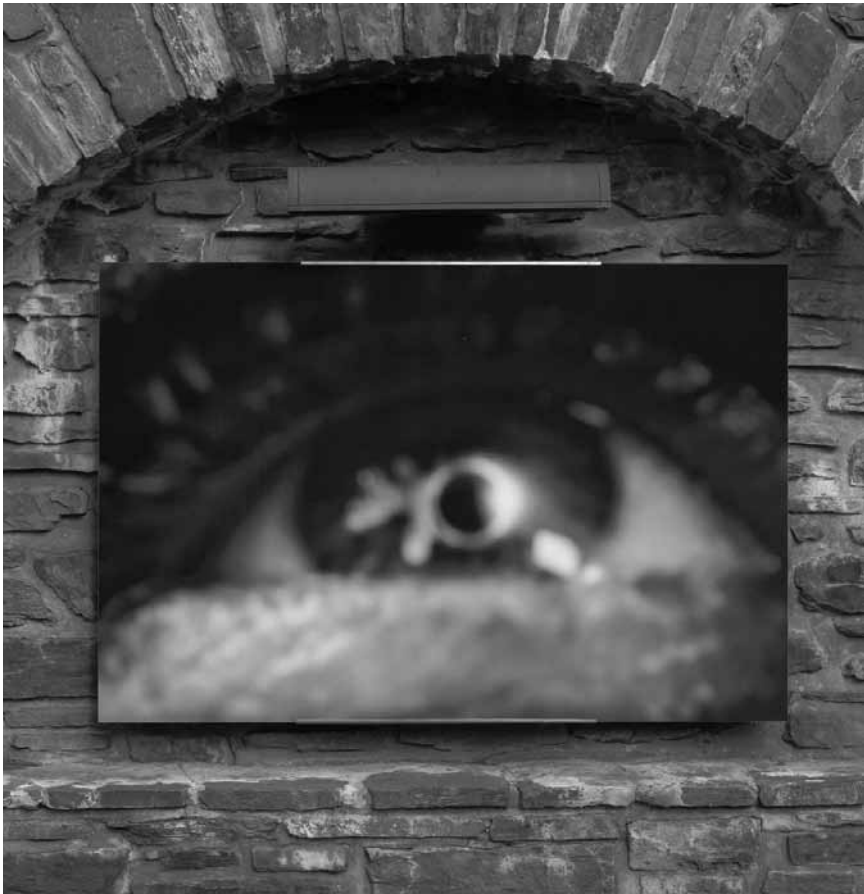
Le flou artistique n'a jamais mieux porté son nom : « Cosmos », de François Fontaine, sous les arcades de Clervaux jusqu'au 16 septembre.