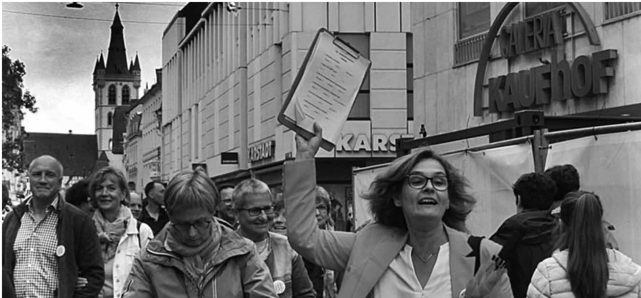
Die fotografische Dokumentation, der theatralen Trierer Stadtrundgänge des letzten Jahres: „Meine liebe Scholle!“ - vom 15. Februar bis zum 1. März in der Tufa.

bis zum 29.2., Sa. + So. 14h - 17h sowie nach Vereinbarung.