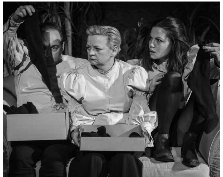
Wenn Goethe und Jelinek sich zusammen tun, kommt Gewaltiges dabei raus: Der „Urfaust & FaustIn and out“ - vom Volkstheater Wien, am 17. April.