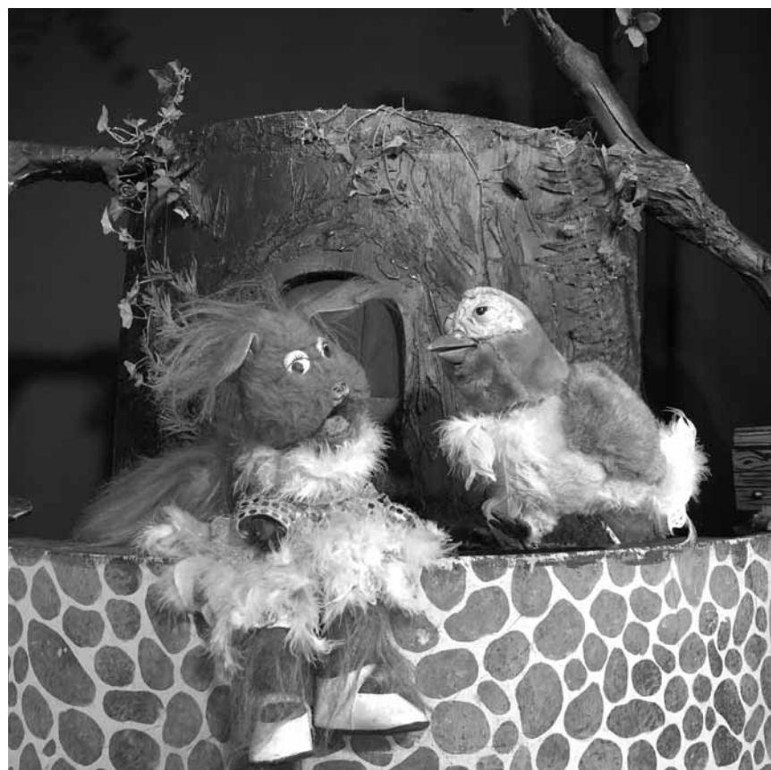
Kopplabunz? Nee - Hoplabum heescht de Poppentheater fir Kanner, deen all Dag ausser sonndes um 16h online um FaceBook-Site vun der Poppespännchen iwwerdroe gëtt.

Ananda Grows, experimental, Crazy Quarantine Sessions, 17h. www.facebook.com/pg/crazyquarantinesessions