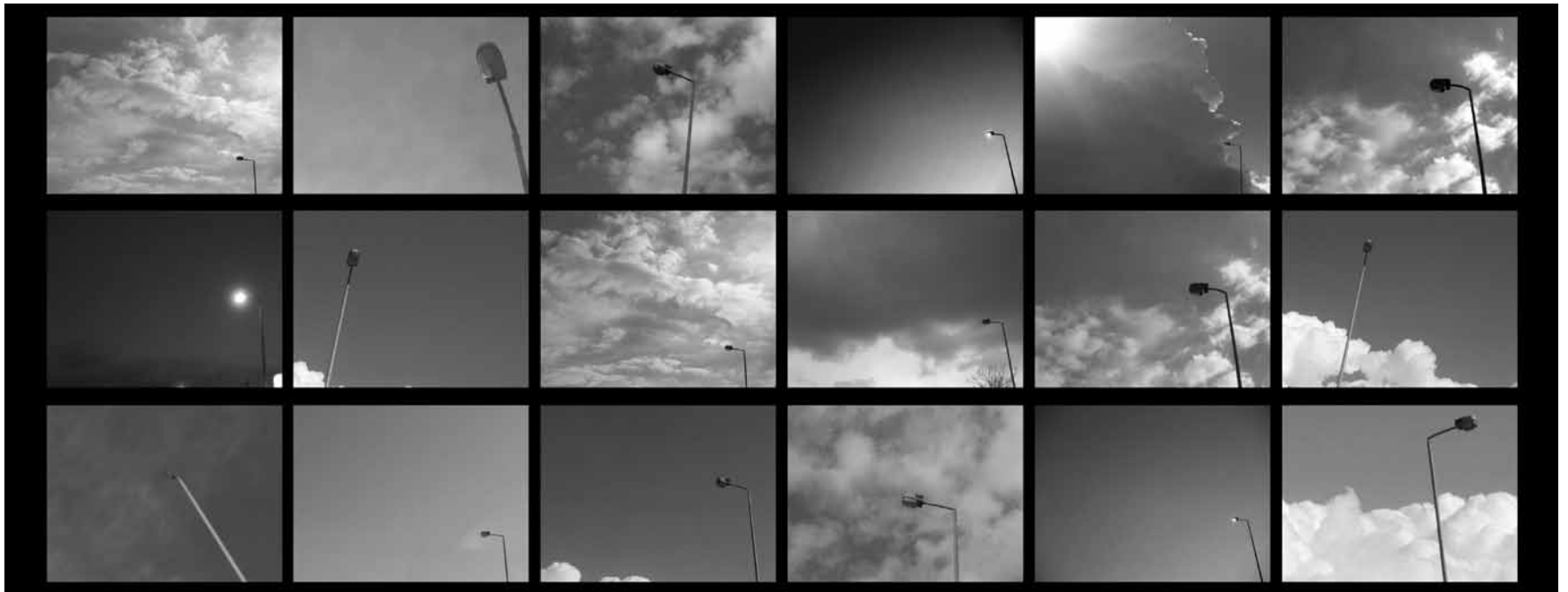
Die Lesung „Make Me Stop Smoking“ von Rabih Mroué hat weniger mit Zigaretten zu tun als mit Zerstörung, Krieg und Krisen im Libanon.