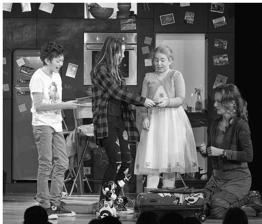
„Patchwork“-Theater für die großen Kleinen, an diesem Samstag, dem 23. Mai - online auf staatsoperlive.com

ON DEMAND Turandot , de Giacomo Puccini, sous la direction de Yannick Nézet-Séguin,