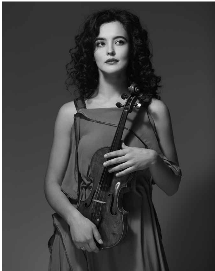
An diesem Freitag, dem 29. Mai gibt es um 20 Uhr Jazz von Alena Baeva & Vadym Kholodenko aus der Philharmonie - live in die eigenen vier Wände.

LIVE Hoplalum Sandmännchen! e Livestream fir Kanner, Figurentheaterhaus Poppespännchen,