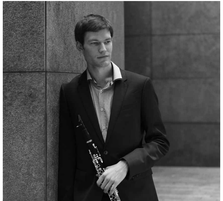
Die Fondation EME lädt zum Konzert auf Apart TV: An diesem Freitag, dem 29. Mai um 15 Uhr ist das Max Mäusen Quartett an der Reihe.