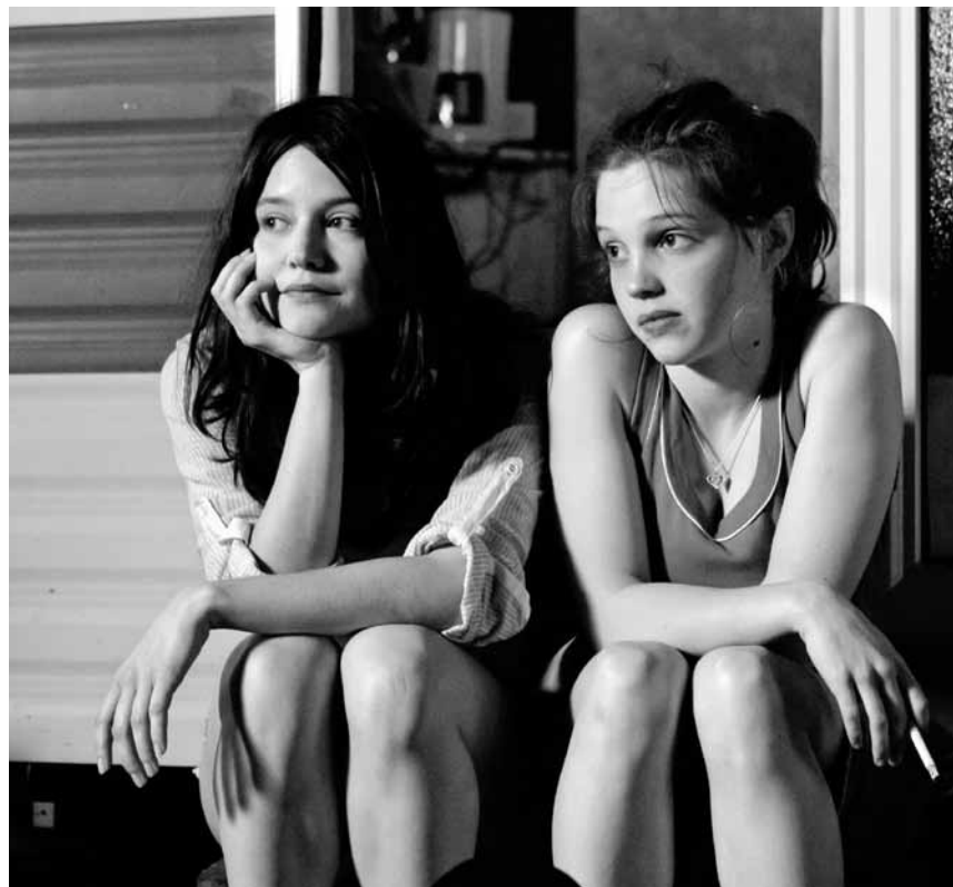
La rencontre avec Julia bouleverse la vie de Diane dans « Puppy Love ». Pourquoi ? Allez voir sur vod.lu !

Mit 36 erleidet Marc einen heftigen Tiefschlag: Er wird schwer krank. Jedes Wochenende entflieht er seinem Job als Geschäftsmann und stürzt sich in rauschenden Luxus und ins Vergnügen. Er reist um die ganze Welt um sich die Oper „Don Giovanni“ anzusehen. Das Werk von Mozart verkörpert für ihn ein Leben ohne Kompromisse.