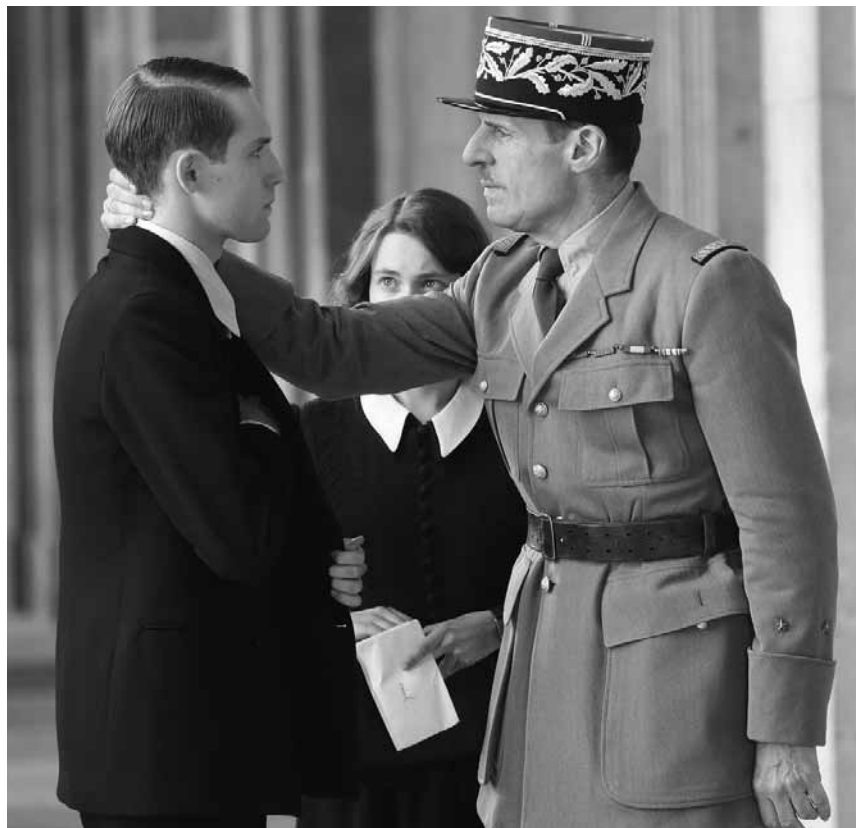
Neuer Film, historischer Plot: „De Gaulle“ spielt im Mai 1940 in Frankreich - und jetzt auch im Kinepolis Kirchberg.

Was Wissenschaftler, Politiker und Aktivisten seit Jahrzehnten prophezeien, ist eingetreten: Die Menschheit steht kurz davor, an einer globalen Nahrungsknappheit zugrunde zu gehen. Die einzige Hoffnung besteht in einem geheimen Projekt der US-Regierung. Der Plan sieht vor, eine Expedition in ein