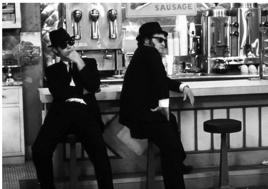
Bereit für eine Band-Reunion an diesem Sonntag, dem 14. Juni, um 21 Uhr? Die „Blues Brothers“ kommen ins Autokino in Mamer.