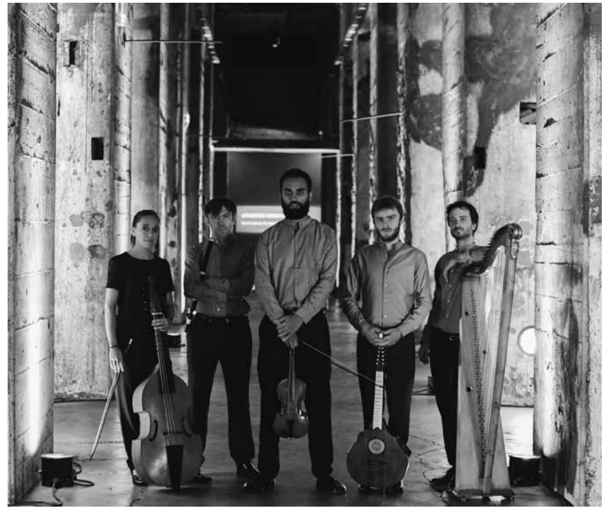
„The Curios Bards“ vereint fünf Musiker*innen, die für keltisch-gälische Musik brennen. An diesem Sonntag, dem 21. Februar um 16 und 18 Uhr gastieren sie im Cube 521.