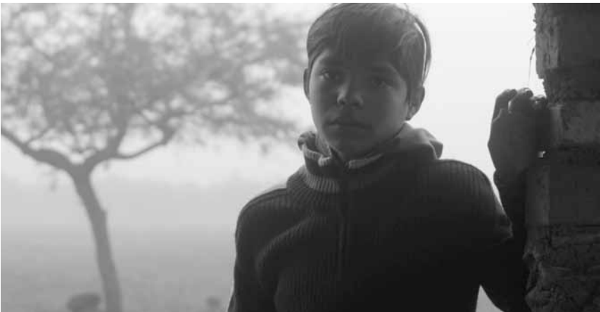
„Sin señas particulares“ spielt in Zentral-Mexiko: Auf der Suche nach ihrem vermissten Sohn, begibt sich eine Mutter auf eine gefährlichen Reise. In fast allen Kinos.

Persischstunden NEW D/RUS/BY 2020 von Vadim Perelman. Mit Nahuel Pérez Biscayart, Lars Eidinger und Jonas Nay. 127'. O-Ton dt. & fr. + Ut. Ab 12.