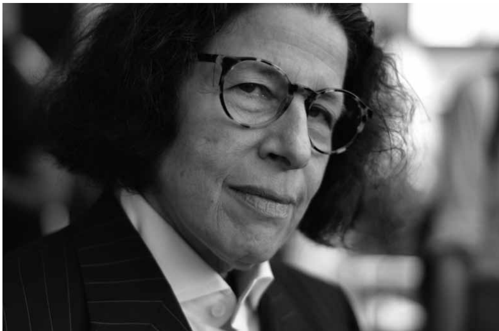
In „Pretend It's a City“ porträtiert Martin Scorsese die Kultfigur Fran Lebowitz.