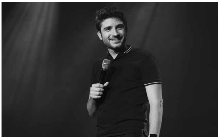
L'humoriste Vêrino joue son programme « Focus » à l'Aalt Stadhaus, le 1er mars à 19h. La représentation affiche complet.

Inscription obligatoire jusqu'au 1.3 : reservation@bnl.etat.lu