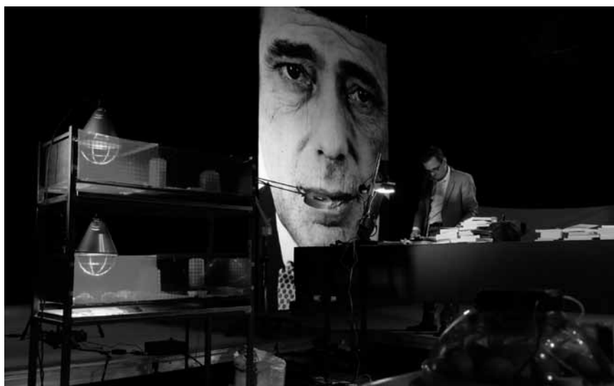
« Calimero » à l'Escher Theater n'a rien à voir avec le petit oiseau noir : la pièce parle de la domination masculine. Les 24, 25 et 26 mars à 20h.