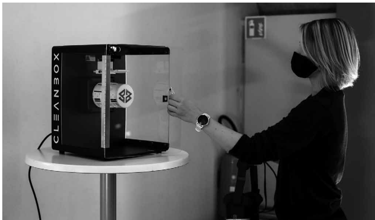
Neimënster prolonge l'invitation au Pavillon réalité virtuelle 2021, mis en place pour le Luxfilmfest, jusqu'au 30 mai.

Archives nationales (plateau du Saint-Esprit. Tél. 24 78 66 60), jusqu'au 24.4, lu. - ve. 8h - 16h.