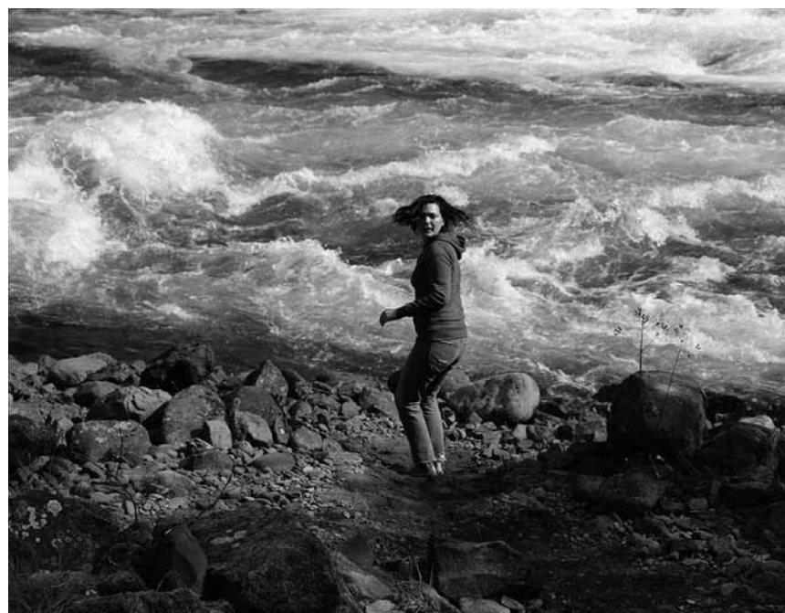
Jessicas Rückzug in die Wildnis wird jäh von einem Psychopathen unterbrochen: „Alone“ – neu im Kursaal und Waasserhaus.