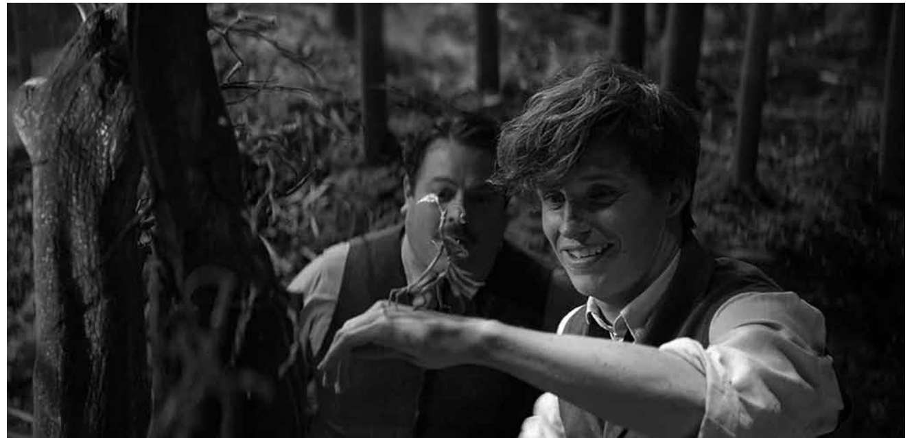
Der Magiezoologe Newt Scamander zieht die Zuschauer*innen mit seinen fantastischen Tierwesen in die Zauberwelt der J. K. Rowling: „Fantastic Beasts and Where to Find Them“ und „Fantastic Beasts: The Crimes of Grindelwald“ im Kinepolis Kirchberg.

Gellert Grindelwald, für dessen Verhaftung Newt Scamander gesorgt hatte, ist die Flucht gelungen. Und nicht nur das: Der Schurke hat