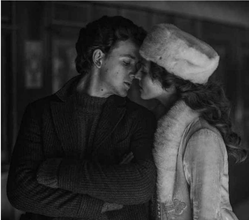
Auf dem Eis der zugefrorenen Flüsse und Kanäle Sankt Petersburgs führt das Schicksal zwei Menschen aus unterschiedlichen Klassen zusammen: „Serebryanye konki (Silver Skates)“, im Kinepolis Kirchberg.

Nach dem wirtschaftlichen Kollaps ihres Arbeitgebers lässt die verwitwete Fern ihr gewöhnliches Alltagsleben hinter sich. Jobs gibt es keine mehr in ihrer Umgebung und ihr Heimatort versinkt zunehmend in Tristesse und Armut. Deshalb bricht Fern auf eine Reise durch den amerikanischen Westen auf. Wo immer sie sich niederlässt, nimmt sie Teilzeitstellen an. Sie genießt ihre Freiheit und die Begegnungen mit den unterschiedlichsten Menschen. Ein berührender Film - ohne moralischen Zeigefinger, dafür aber mit starken Frauenfiguren.