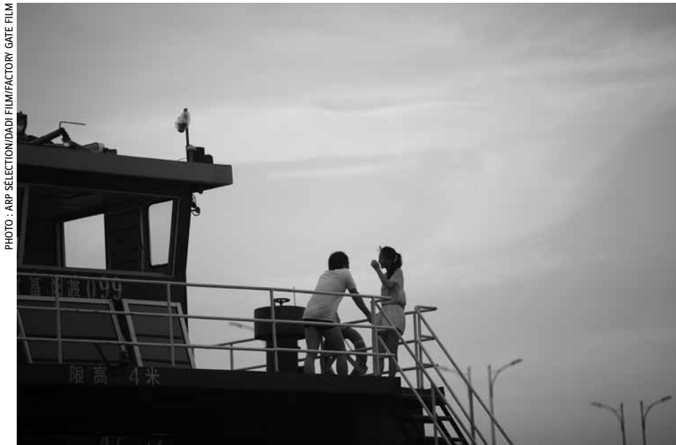
Une idylle se noue sur le fleuve Fuchun.