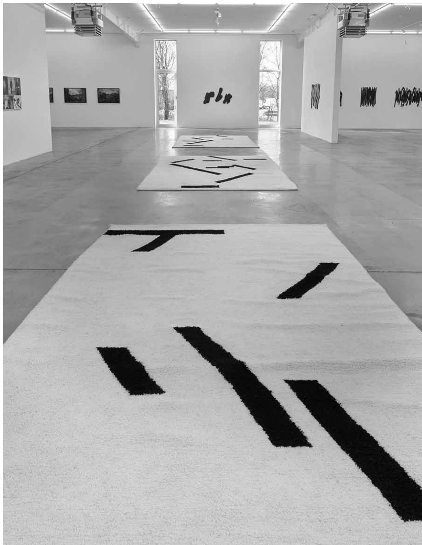
L'art de Tania Mouraud est multidisciplinaire. L'expo « Mezzo forte » à la galerie Ceysson & Bénétière contient entre autres des peintures, des dessins et des photographies. Jusqu'au 22 mai.