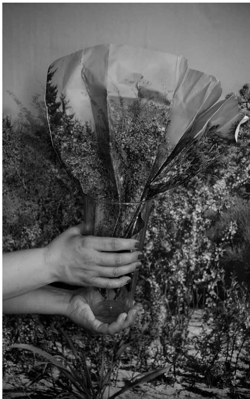
Au Cercle Cité, on repense la nature : « Rethink Nature » est une exposition collective, avec entre autres des œuvres de Vanja Bucan. À partir de ce vendredi 30 avril et jusqu'au 27 juin.

œuvres de Pascale Behrens, Patricia Lippert et Stefan Seffrin, Schöfflinger Korschthaus (2, av. de la Libération), jusqu'au 22.5, ma., me., ve., sa. 10h - 13h + 14h - 18h, je. 10h - 13h. Fermé les jours fériés.