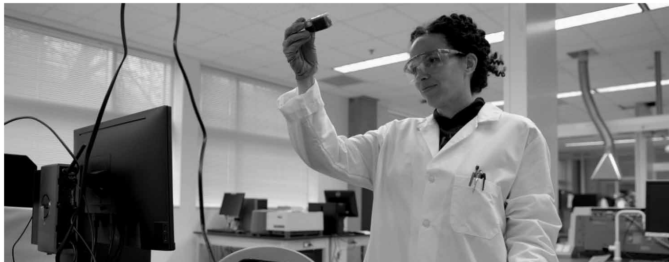
Drei Forscherinnen geben Einblick in ihre Karriere und die Schwierigkeiten, sich in ihrem Feld durchzusetzen: „Picture a Scientist“ - neu in den regionalen Kinos.

Zusammen mit den Menschen lebten Drachen einst in harmonischem Einklang. Doch als eine böse Macht ihre Welt bedrohte, opferten sich die Drachen, um die Menschheit zu