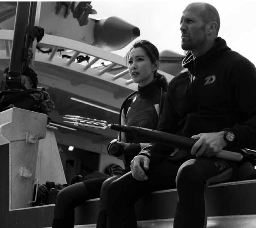
Ein Riesenhai, ein U-Boot-Wrack und mittendrin der Taucher Jonas Taylor: „The Meg“ läuft wieder im Kinopolis Kirchberg.

An zéro - comment le Luxembourg a disparu Checker Tobì und das Geheimnis unseres Planeten Falling Nomadland Oops! The Adventure Continues ... Picture a Scientist Quo Vadis, Aida? Sheytan vojud nadarad Wolfwalkers