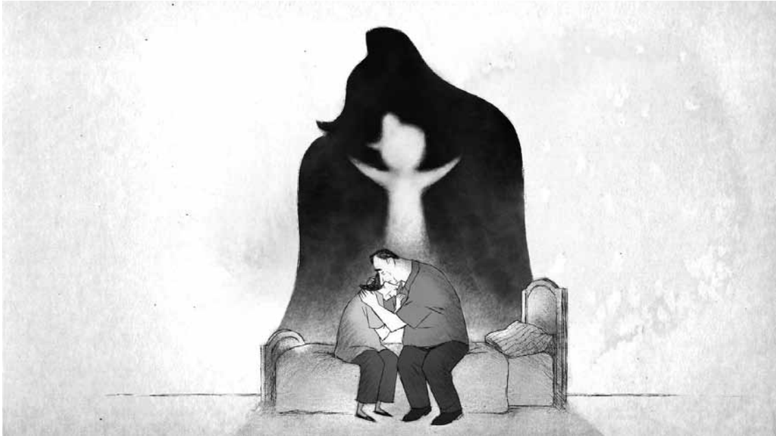
Die Trauer um ihr Kind eint und trennt die Figuren in „If Anything Happens I Love You“ zugleich.