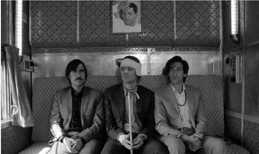
Wes Anderson schickt drei Brüder auf einen Selbstfindungstrip durch Indien: „The Darjeeling Limited“ läuft am Samstag, den 8. Mai um 20 Uhr in der Cinémathèque.

interventions d'experts parmi les plus influents de notre époque, il propose un voyage à travers l'histoire moderne de nos sociétés et met en perspective la richesse et le pouvoir d'un côté, le progrès social et les inégalités de l'autre.