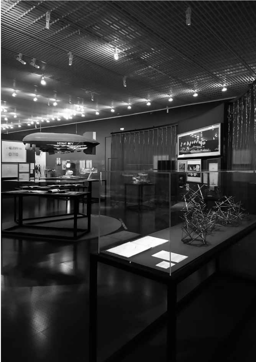
Tubes, montgolfières, ballons, sondes - l'expo « Aerodream » réunit des objets gonflables.