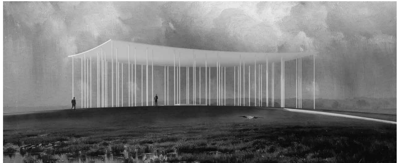
Der Frage nach der „Erinnerungskultur in Raum und Zeit“ gehen die Studierenden des Fachbereichs Architektur in ihrem Ausstellungsprojekt in der Tufa in Trier nach - bis zum 11. Juli.

Skulpturen, Museum für Vor- und Frühgeschichte (Schlossplatz 16. Tel. 0049 681 9 54 05-0), bis zum 7.11., Di., Do. - So. 10h - 18h, Mi. 10h - 20h.