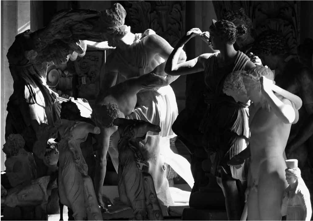
Sous le titre « Exposure : Dusk », la galerie Ceysson & Bénétière montre des vidéos de l'artiste Marie Josée Burki jusqu'au 30 juillet.