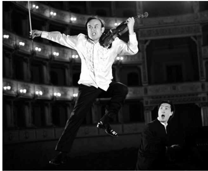
Aleksey Igudesman et Hyung-ki Joo sont non seulement musiciens, mais aussi acrobates et comédiens. Leur nouveau spectacle, « And Now Beethoven », est à voir le 26 juin à 18h et 20h au Cube 521.