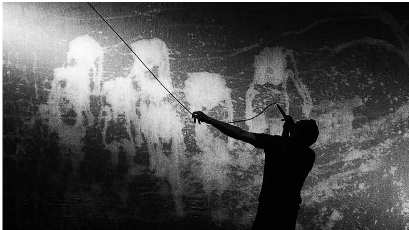
« Le dernier ogre » raconte entre slam, concert et live painting l'histoire des ogres, ces personnages effrayants de conte de fées. À Neimënster, le 26 juin à 20h30.

ONLINE Kulti4t , mit Upfluss (St. Ingbert) & Fashioned from Bone, sparte4, Saarbrücken (D), 19h. Tél. 0049 681 30 92-486. www.sparte4.de dringeblieden.de/saarlandisches-staatstheater/videos