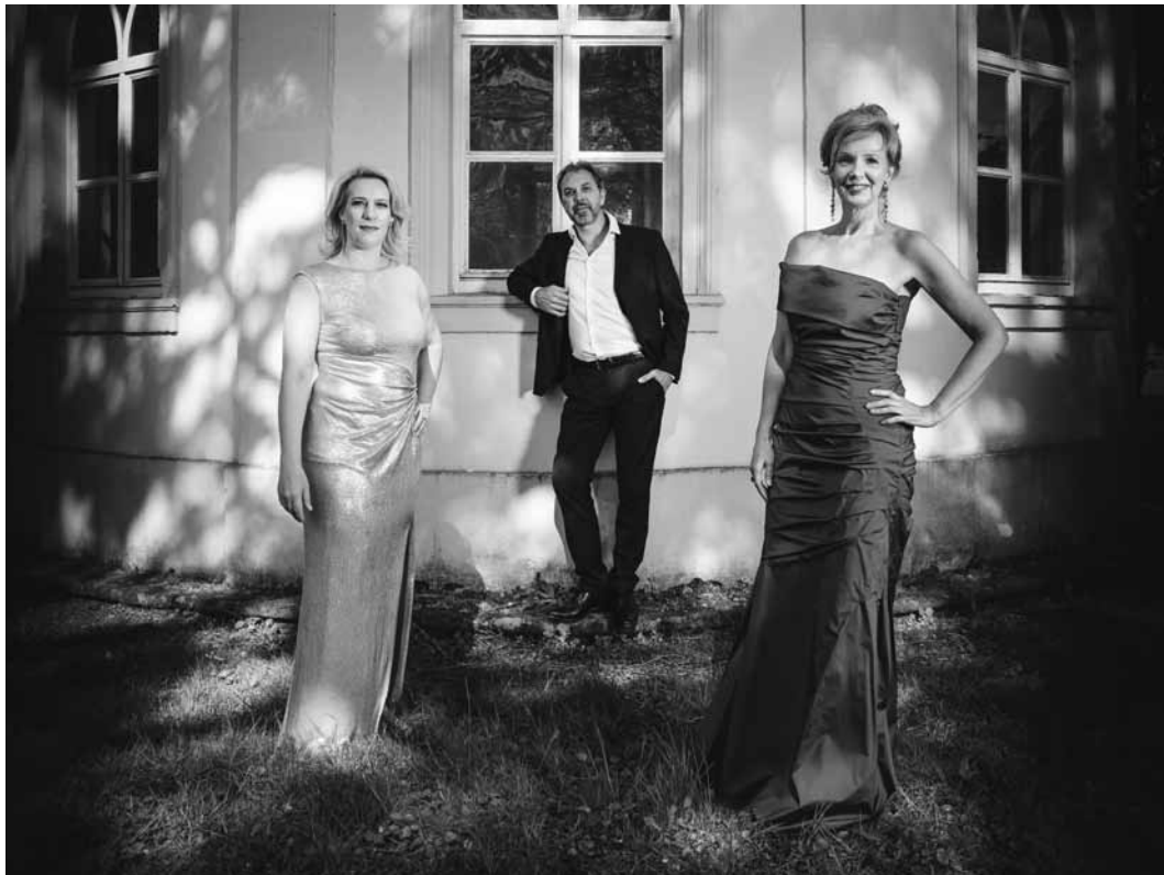
Les membres du trio Cénacle.