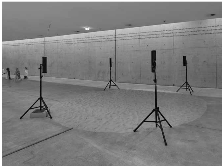
L'artiste britannique Hanne Lippard nous parle à travers ses installations : « Le langage est une peau », à voir au 49 Nord 6 Est - Frac Lorraine du 3 septembre au 6 février.

Visites guidées les me. 19h (GB), sa. 11h (L), 15h (D), 16h (F), di. 11h (GB), 15h (D), 16h (F). « Ask Me », médiateurs-trices disponibles les sa. et di. 10h - 18h. Visites pour enfants les ve. 27.8 (F) et 3.9 (L) à 15h, le me. 1.9 à 15h (F) (> 6 ans), inscription obligatoire. Visites en famille les di. 28.8 (F) et 5.9 (L) à 10h, inscription obligatoire. « Mat Boma a Bopa » visite guidée pour enfants avec leurs grands-parents le lu. 30.8 à 15h (L) (> 6 ans), inscription obligatoire.