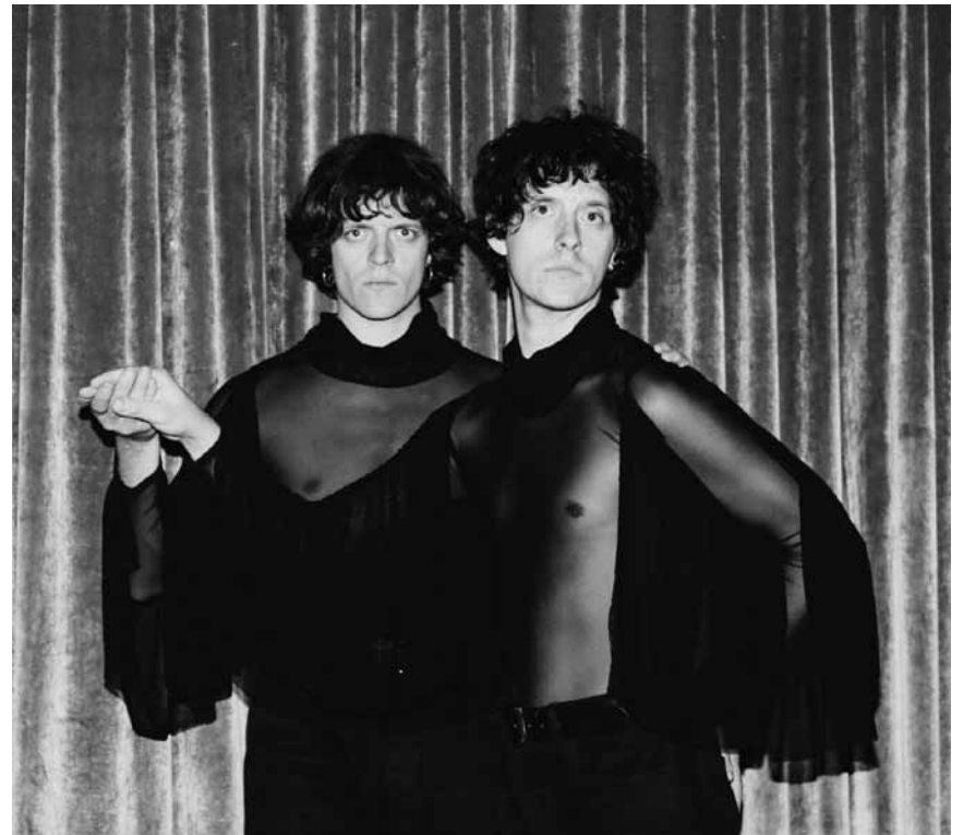
The art pop duo Faux Real is part of the lineup for the „Congés annulés“ festival at the Rotondes and will perform on July 28th at 8 pm.