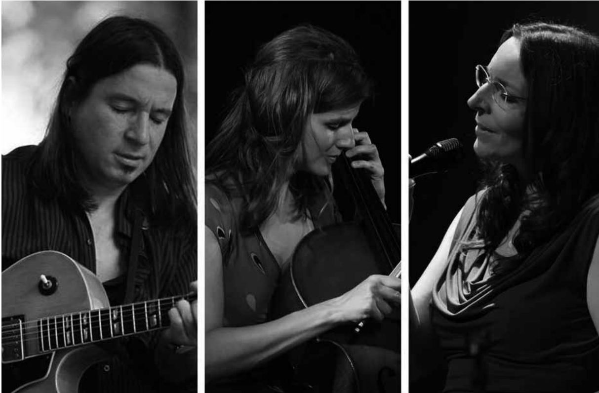
Un trio acoustique du cru pour clore les sessions de jazz dominicales cette saison.