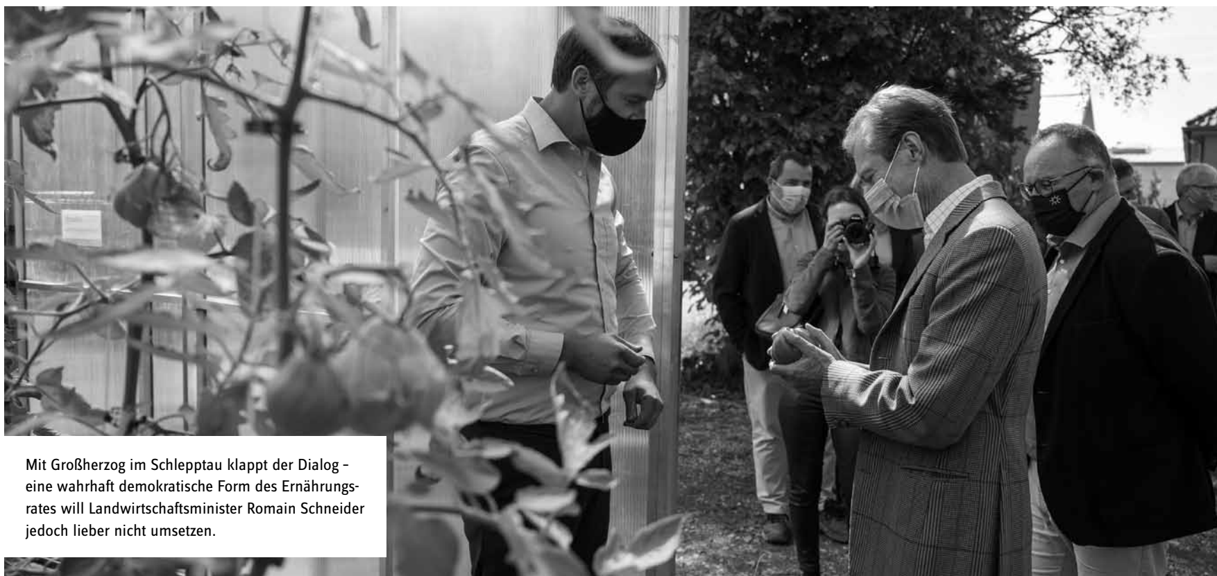
Mit Großherzog im Schlepptau klappt der Dialog – eine wahrhaft demokratische Form des Ernährungsrates will Landwirtschaftsminister Romain Schneider jedoch lieber nicht umsetzen.