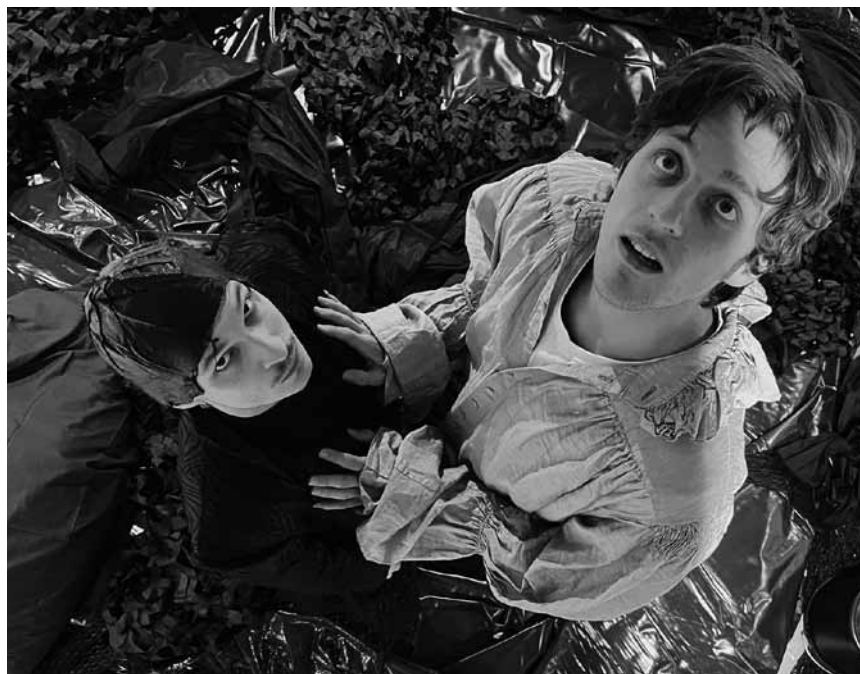
Im Rahmen des Festivals Water Falls wird am 7. und 8. August, um 20 Uhr, das Stück „Rosenkranz und Guldernstern auf Greta“ im Naturpark Öwersauer aufgeführt.

Campino präsentiert: Hope Street , Singer-Songwriter, centre culturel régional opderschmelz, Dudelange , 20h. Tél. 51 61 21-811. www.opderschmelz.lu AUSVERKAUFT!