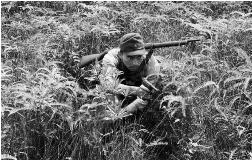
« Onoda » joue au Japan, fin 1944 où peu avant le débarquement américain, le soldat Onoda mène une guerre secrète. Au cinéma Utopia.