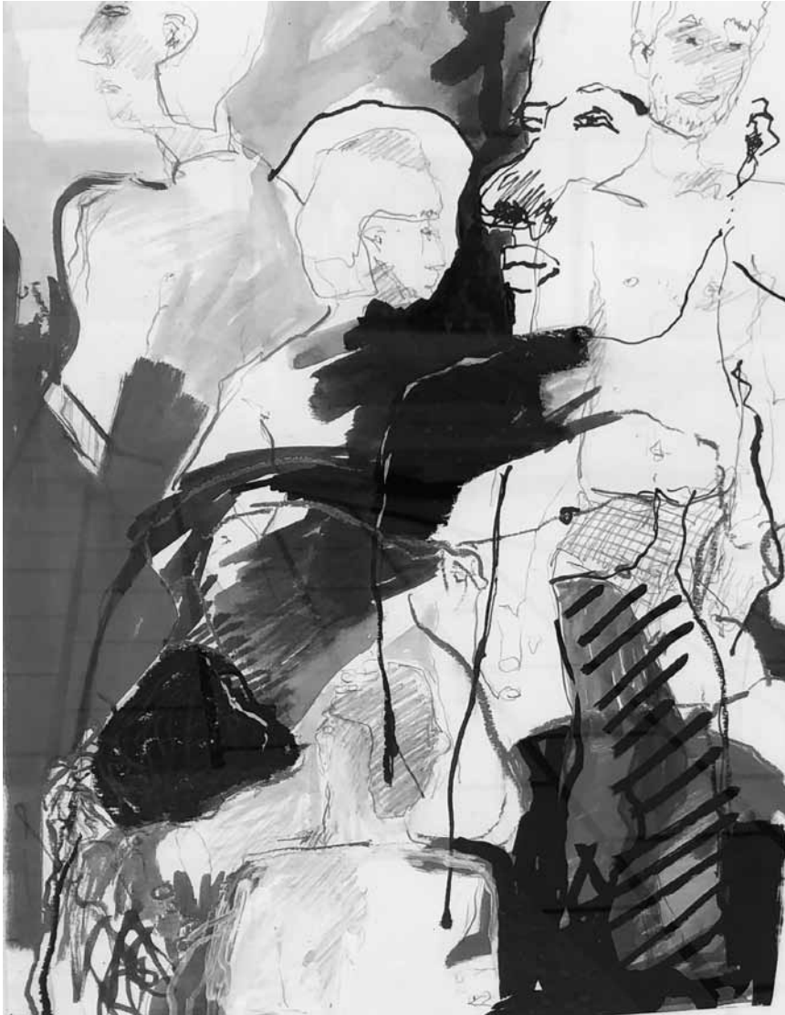
Auf der Suche nach einem neuen Kunstwerk fürs Wohnzimmer? Die Tufa zeigt bis zum 5. September den neuen Bestand der Artothek.