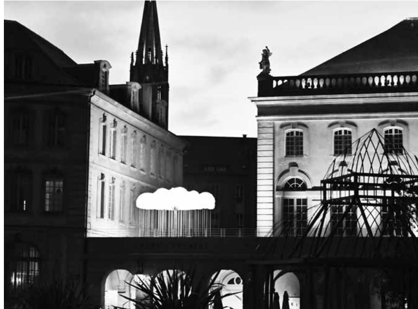
Le festival international d'arts numériques «Les Constellations de Metz» est à voir dans toute la ville de Metz, encore jusqu'au 4 septembre.

œuvres de la collection autour de la question de la représentation de